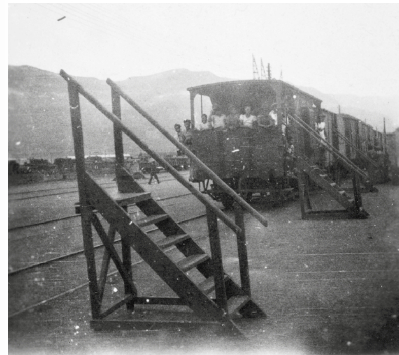
Trein en instaptrapje in Ataka, Egypte, waar repatrianten een kledingpakket overhandigd krijgen. Met een plunjezak met kleding en schoenen reizen ze in deze treintjes weer terug naar de boot.

Op weg naar Nederland krijgen de evacués in Ataka, een voormalig Brits legerkamp in de Egyptische woestijn ten zuiden van Suez, warme kleding uitgereikt door medewerkers van het Rode Kruis. In een grote loods, opgetrokken uit ijzeren golfplaten, zijn een kantine en kledingmagazijn ondergebracht. Terwijl de passagiers in afwach-