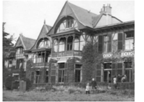
Marinepension La Forêt in Doorn waar geëvacueerde marinegezinnen uit Nederlands-Indië vanaf eind 1945 worden opgevangen.

De gezinshereniging, gecoördineerd door het Nederlands-Indische Rode Kruis, verloopt zeer moeizaam. Nederlandse KNIL-militairen die dwangarbeid in Birma, Siam, China en Japan overleefd