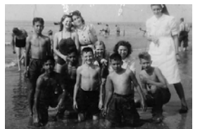
Een groep gerepatrieerde Hollandse en Indische kinderen is onder begeleiding van het verplegend personeel van Paleis Lange Voorhout een dagje uit naar Scheveningen in de zomer van 1947.