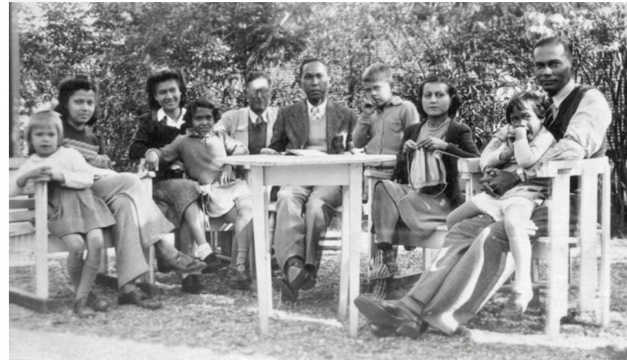
De eerste Indische verlofgangers in hotel-pension Het Witte Huis in Laren, 22 september 1947 (privé-collectie dhr. J.M. Koeman).

Oorlogsevacués die na zes maanden nauwelijks of geen inkomen hebben, krijgen de status van oorlogsslachtoffer en worden door het CBVO ondergebracht in inrichtingen en evacuatiekampen. Hun uitkeringen voor levensonderhoud zijn dusdanig lager geworden dat ze niet langer in hotels of pensions kunnen verblijven. Het CBVO heeft zeventien Inrichtingen voor Gerechtvaardigden uit Indië (IGI) in gebruik voor rekening van het Ministerie van Overzeesche Gebiedsdeelen.