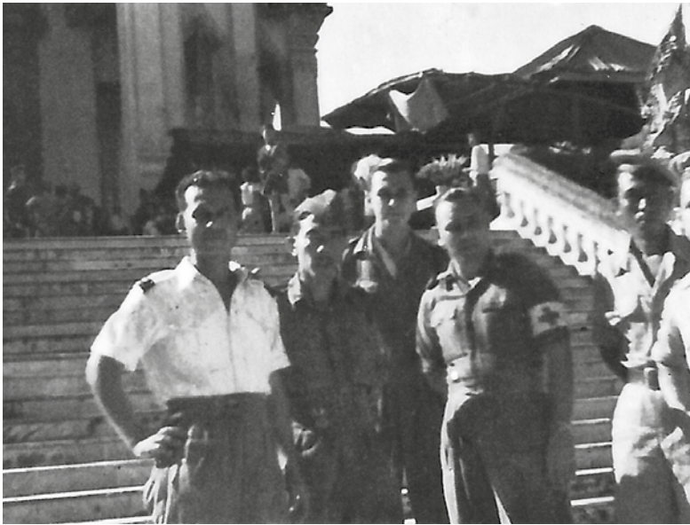
Bevrijde Nederlandse krijgsgevangenen in Nakorn Pathom, Siam, 1945.

hebben, wachten maandenlang op verscheping.