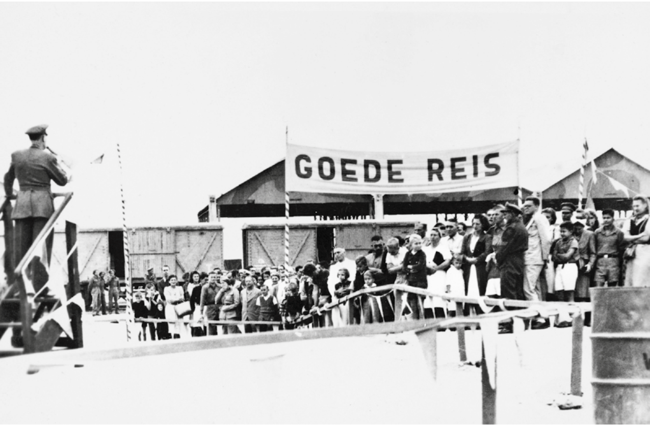
Bij hun vertrek uit Ataka worden repatrianten toegesproken door de legerleider van het kamp. Deze afbeelding was in Ataka als ansicht verkrijgbaar (collectie Schreuder, Historisch Beeldarchief Migranten, IISG Amsterdam).

ting van kleding zijn, worden ze door lokaal personeel getraceerd op thee, koffie en limonade, cake, broodjes en koekjes.