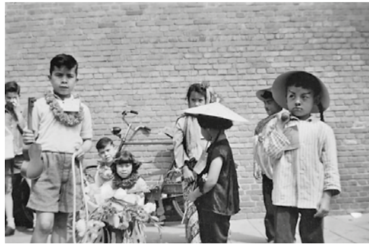
Indo-Europese kinderen uitgedost als Hawaïanen en Chinezen tijdens een optocht.