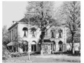
Buitenplaats Glinstra State in het Friese Bergum functioneert vanaf 1947 als tijdelijke opvang voor Indische oorlogsevacués.

Het gezin Rijken wordt bij de bediendeningang van Paleis Lange Voorhout opgewacht door een boomlange bediende. Met de koffers