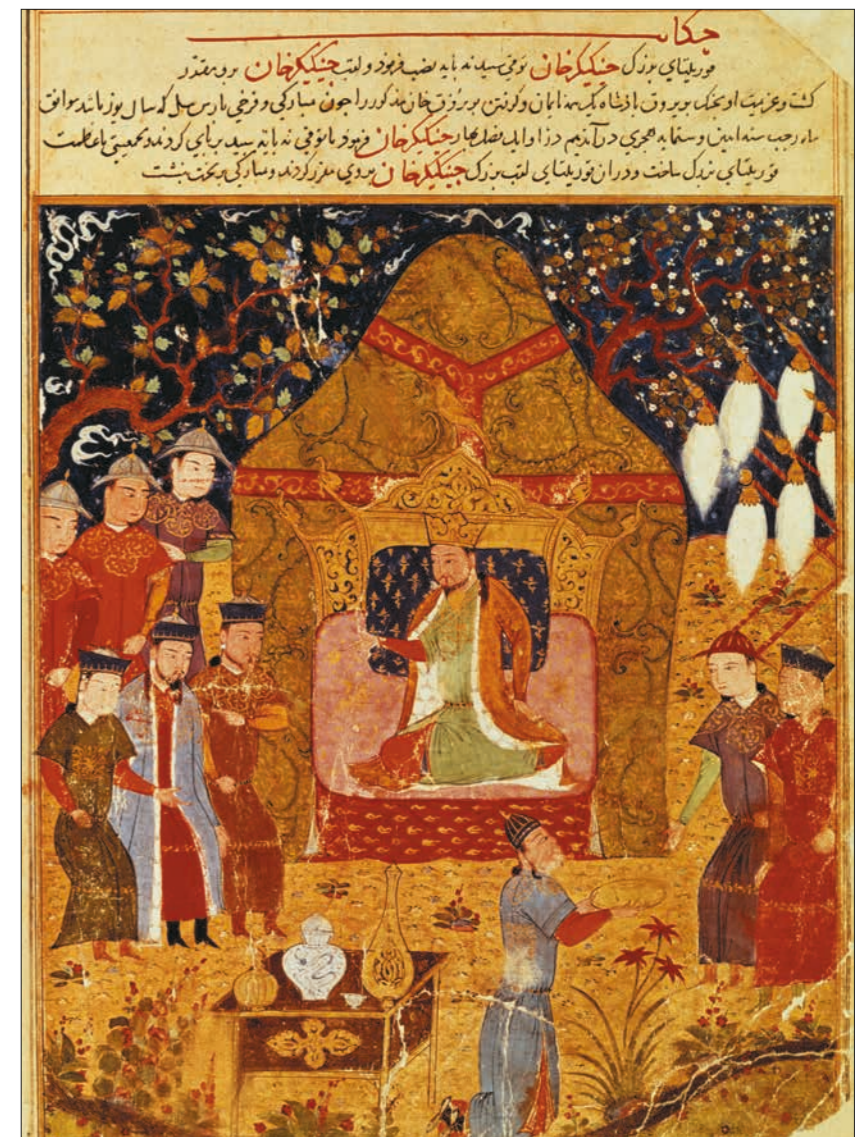
Boven: Deze illustratie uit een Perzische literaire tekst toont Djengis Kan in zijn tent. Vorige bladzijde: Portret van Djengis Kan (1206-1227), stichter van de keizerlijke dynastie, de Yuan, die China tot het centrum van het grote Mongoolse Rijk maakte.

De meeste leden van de Gouden Horde trokken zich terug naar het steppegebied, van waaruit ze hun opperheerschappij over de gebieden van de Russen uitoefenden. Ze benoemden lokale belastinginners om toezicht te houden op de tributen van de Russische vorsten-