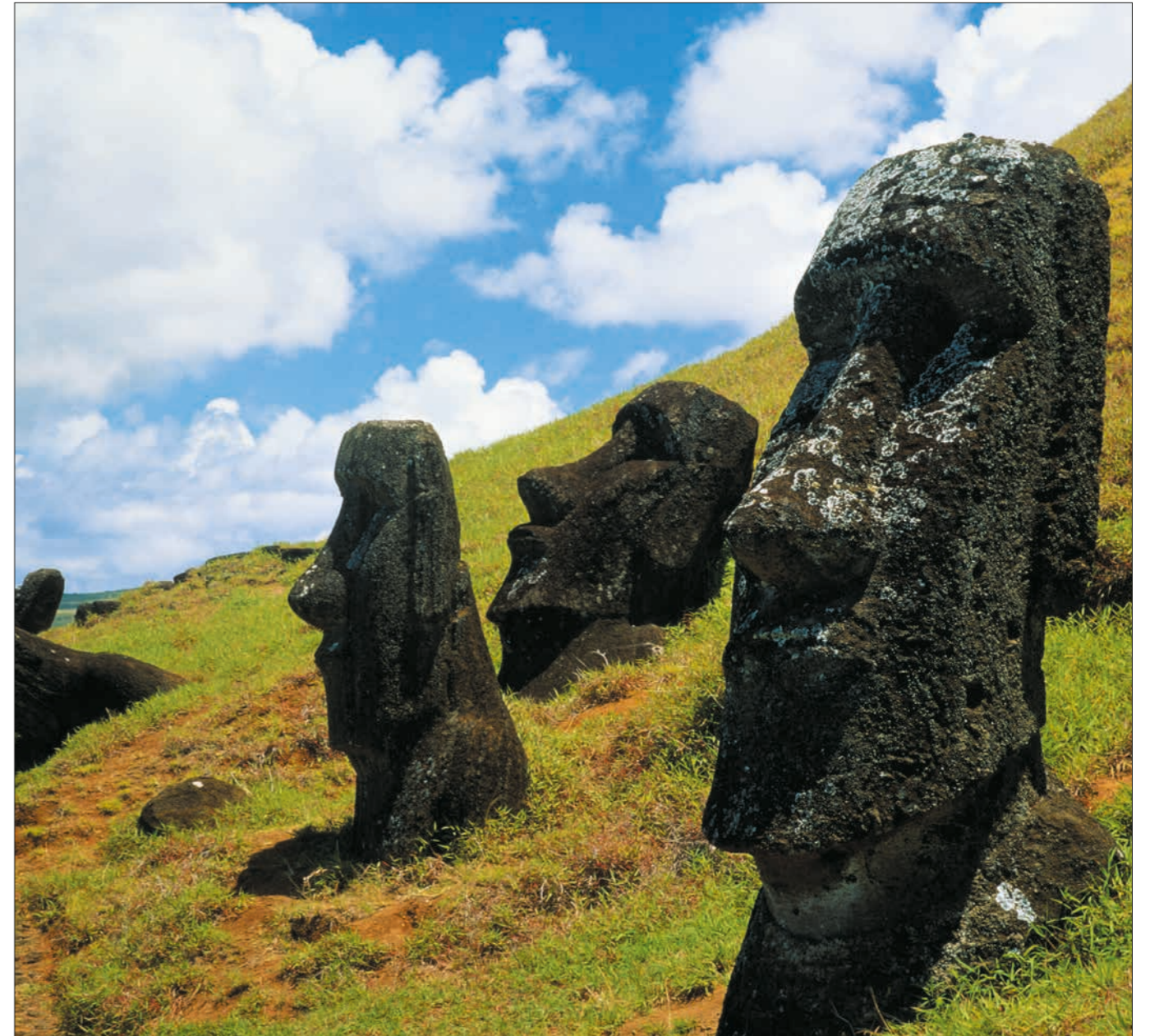
Vorige bladzijde: Uluru of Ayers Rock. Deze grootste monoliet ter wereld rijst ruim 300 m boven de woestijn uit en heeft een omtrek van bijna 8 km. Boven: Enkele van de beroemde beelden van Paaseiland. De beelden variëren in hoogte van ongeveer 2 tot meer dan 9 m.

hun geloofssysteem, 'de droomtijd'. De droomtijd is een complexe mythologie waarin verhalen fungeren als mythen, maar ook informatie geven over het land, zoals waar men waterpoelen kan aantreffen. De verbinding tussen de droomtijd en het land betekende dat veel plaatsen spirituele betekenis hadden voor de aboriginals. Het bekendst op dit gebied is de Uluru of Ayers Rock. Er zijn verschillende animistische geesten, zoals de bunyip, het duivelse wezen dat in moerassen, rivieren en krekken leeft, en iedereen verslindt die deze plaatsen 's nachts bezoekt. De religie op de Polynesische eilanden verschilde van die