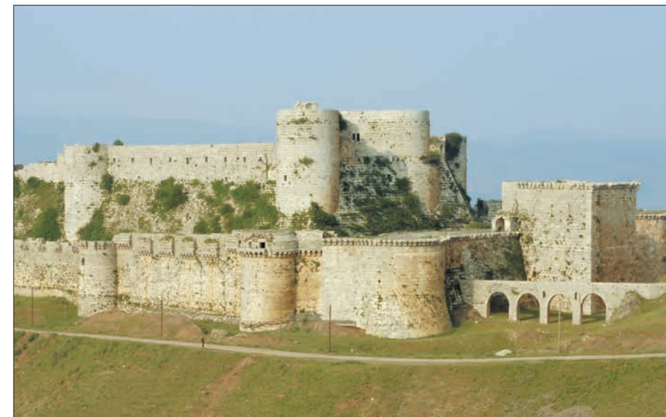
Boven: Het Krak des Chevaliers (Kasteel der Ridders) in Syrië werd in 1142 veroverd door de johannieters. Vorige bladzijde: Een miniatuur uit een algemene kroniek die de plundering van Jeruzalem illustreert na de inname door de christenen in 1099.

Hoewel de Byzantijnen de eerste kruistocht hadden bewerkstelligd, hadden ze zich al gauw gedistantieerd van de Kerk van Rome, die ze grondig wantrouwden. Niet alleen de Turken vielen de Byzantijnen aan, maar ook de