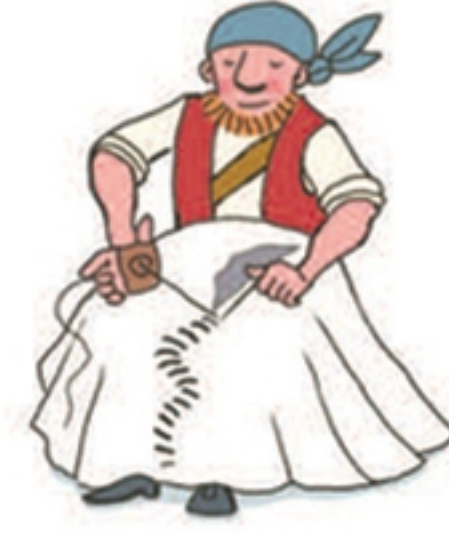
De zeilen repareren