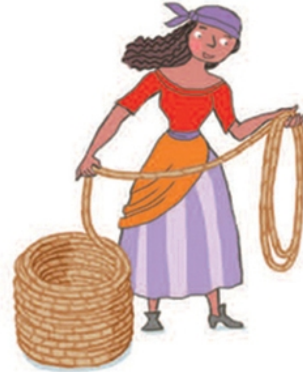
Touwen netjes oprollen