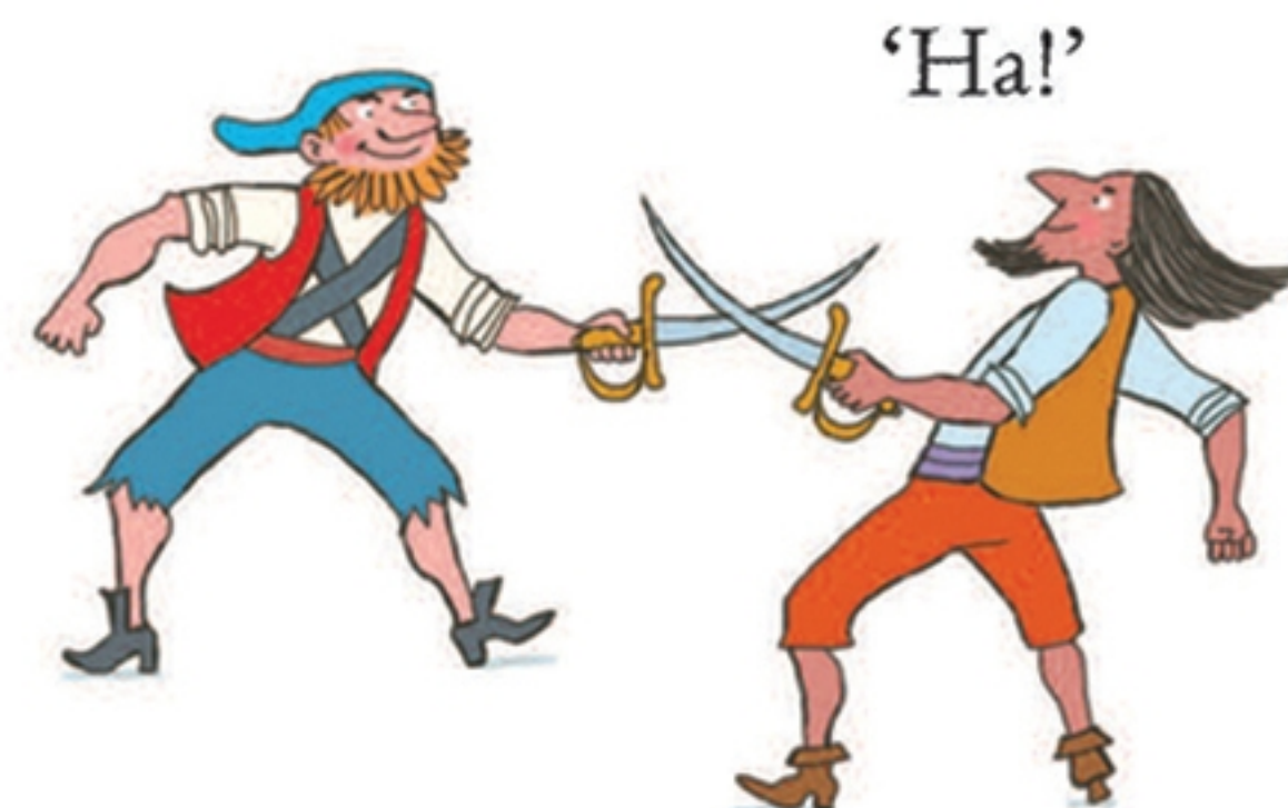
Deze piraten oefenen wat met zwaardvechten.