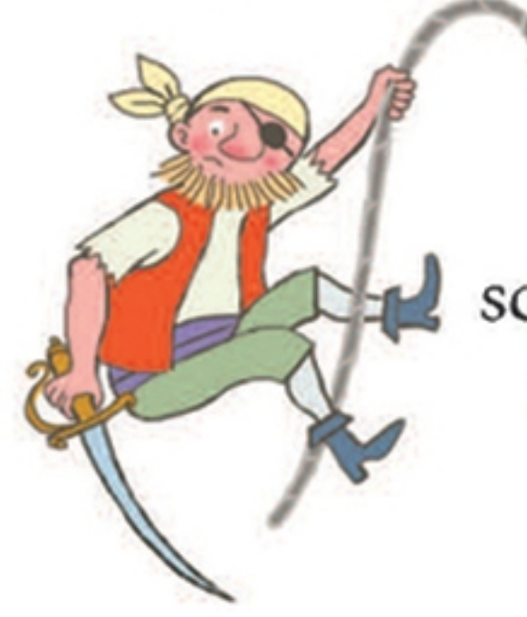
In het scheepswant klimmen

Als ze geen schatten stelen, hebben piraten karweitjes te doen. Help de bemanning om hun schip netjes te houden door de tekening aan de rechterkant aan te vullen met de krasplaatjes.