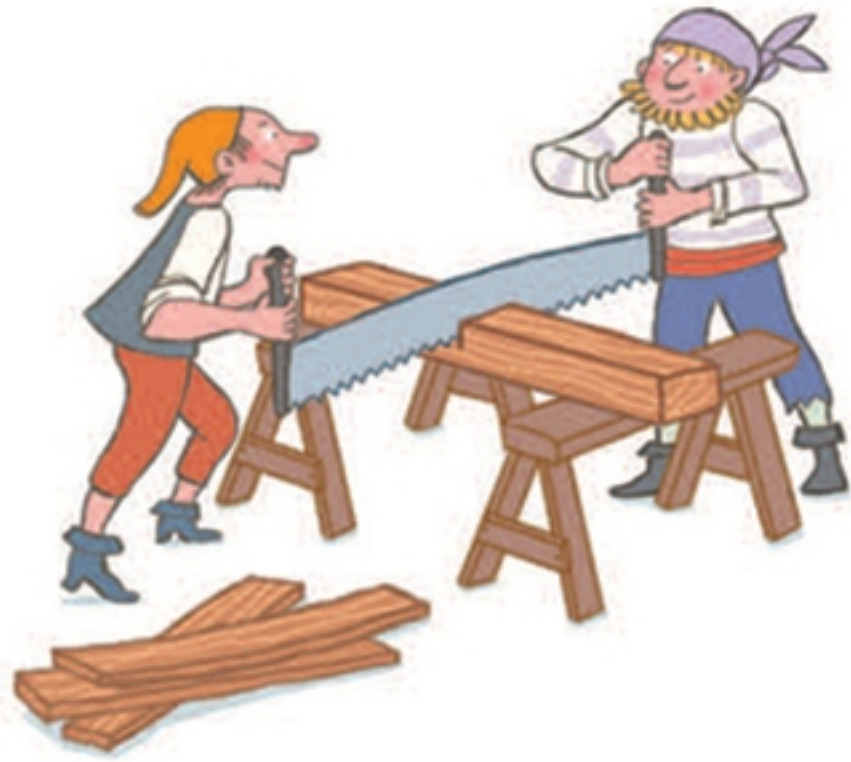
Deze nieuwe planken vervangen de rotte planken in het schip.