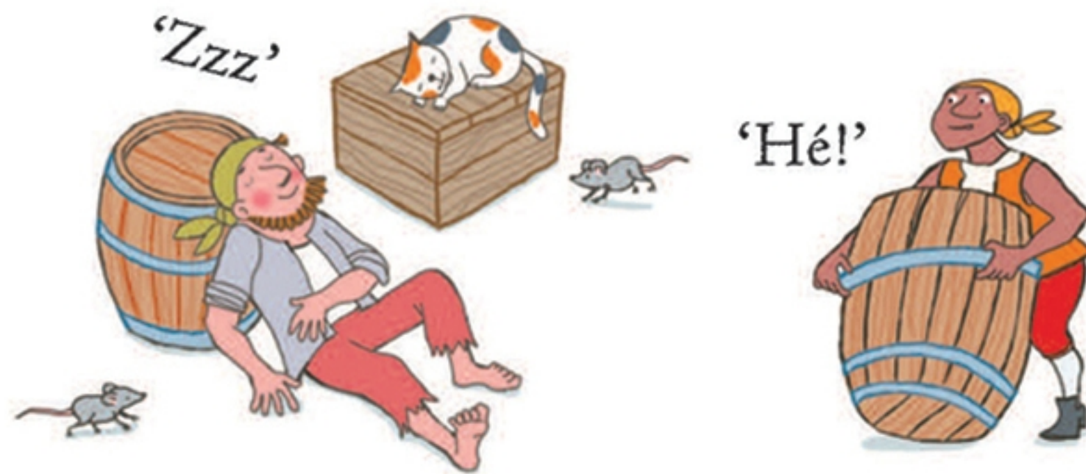
Deze piraat doet stiekem een dutje.