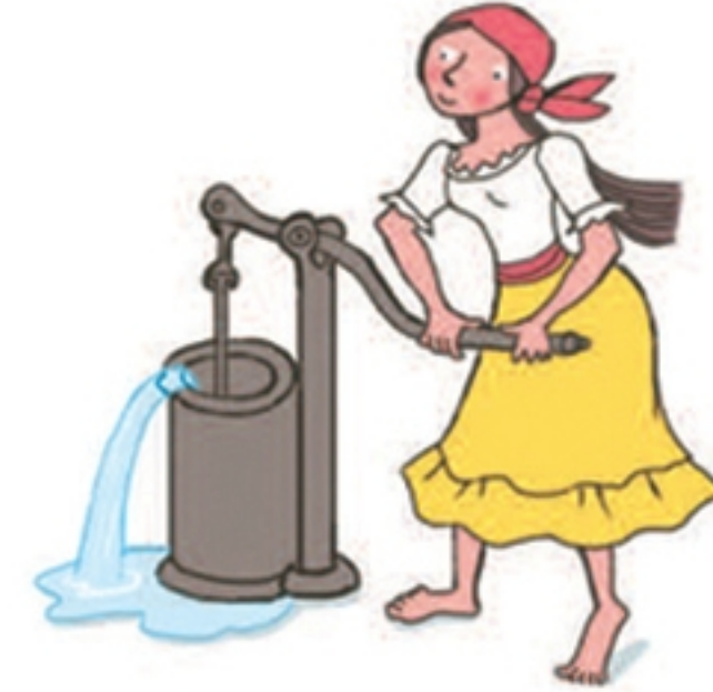
Afvalwater uit het scheepsruim pompen