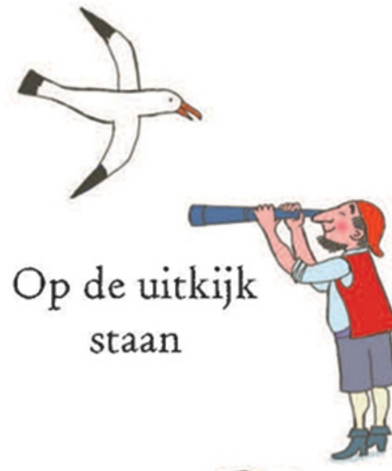
Op de uitkijk staan