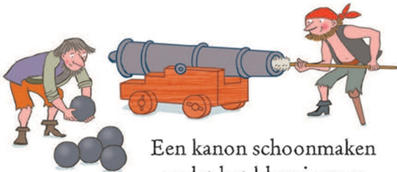
Een kanon schoonmaken zodat het klaar is voor het volgende gevecht