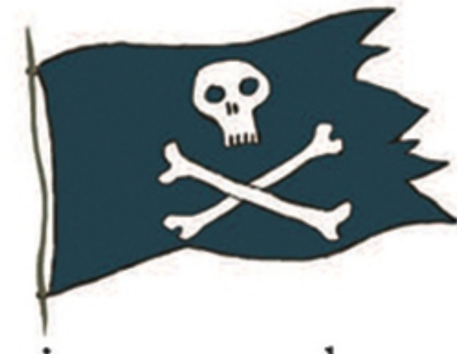
Een piraat moet deze vlag aan de scheepsmast strijken.