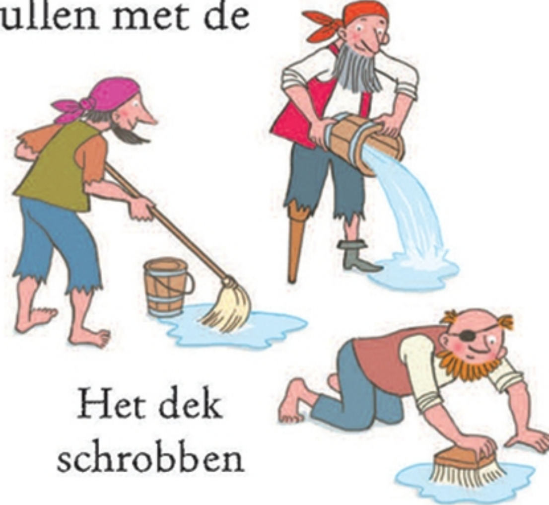
Het dek schrobben