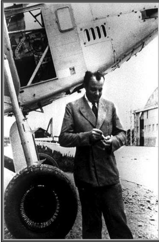
Antoine de Saint-Exupéry, 1933

Si elles ne sont pas tout à fait autobiographiques, ses œuvres sont largement inspirées de sa vie de pilote aéropostal, excepté pour Le Petit Prince (1943) — sans doute son succès le plus populaire (il s'est vendu depuis à plus de 134 millions d'exemplaires dans le monde, et se trouve être donc le second ouvrage le plus vendu au monde après la Bible) — qui est plutôt un conte poétique et philosophique.