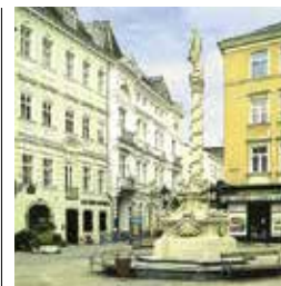
De Mariazuil in het midden van de barokke Herrenplatz