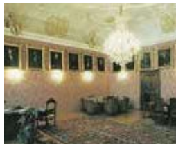
Portretten sieren de muren van de Burgemeesterskamer in het Rathaus