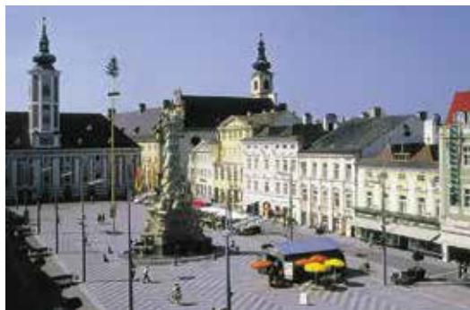
De Rathausplatz in St. Pölten met de zuil van de Heilige Drievuldigheid

St. Pölten, sinds 1986 de hoofdstad van de deelstaat Neder-Oostenrijk, was in 1159 de eerste Oostenrijkse stad die stadsrechten kreeg. Zijn geschiedenis gaat terug tot de Romeinse tijd. In de 8ste eeuw lag hier een belangrijke benedictijnenabdij. St. Pölten groeide sterk in de baroktijd, toen belangrijke kunstenaars als de architect Jakob Prandtauer en de schilders Daniel Gran, Paul Troger en Bartolomeo Altomonte zich hier hadden gevestigd. Nadat de handel zich had verplaatst van de Donau naar routes over land werd St. Pölten in economisch opzicht de belangrijkste stad van Neder-Oostenrijk.