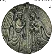
Detail op de deur van de dom

Het prachtige centrum, dat uit de barok dateert en waar ook nog enkele oudere gebouwen staan, ligt ten zuiden van het station tussen Domplatz, Riemerplatz en Rathausplatz. Het centrum is niet groot en voor een groot deel autovrij, zodat u zich gemakkelijk te voet kunt verplaatsen en de stad op uw gemak kunt verkennen. St. Pölten bezit naast de barokgebouwen ook recentere architectuur die het bezichtigen waard is.