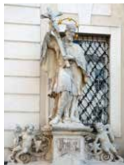
Beeld voor het Institut der Englischen Fräulein

Linzer Strasse 9-11. Tel. 02742-3521880. Kerk Open dag. 10.00-17.00 uur. Het Instituut van de Engelse Zusters, dat werd opgericht door de Engelse non Mary Ward, gaf onderwijs aan adellijke meisjes. Het instituutgebouw, dat uit 1715 dateert en 50 jaar later werd uitgebreid, is een van de mooiste barokgebouwen van Neder-Oostenrijk. Jakob Prandtauer ontwierp de prachtige wit-roze gevel, die wordt onderbroken door zwarte, smeedijzeren tralies voor de ramen en beelden-groepen.