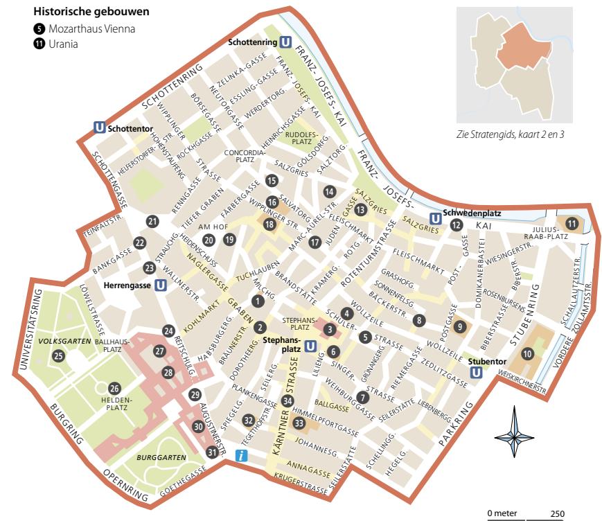
Zie Stratengids, kaart 2 en 3