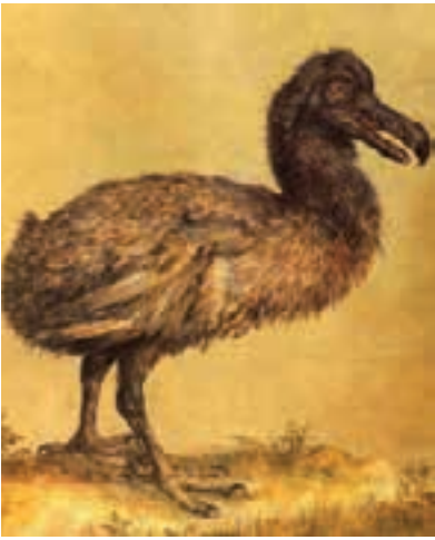
Afbeelding van een dodo uit de collectie van keizer Rudolf II, gemaakt door Jacob Hoefnagel, van 1602 tot 1613 hofschilder in Praag. De dodo is uitgestorven.

exotische wonderbaarlijkheden niet alleen ordenen, maar er ook van leren en ze aan andere mensen laten zien.