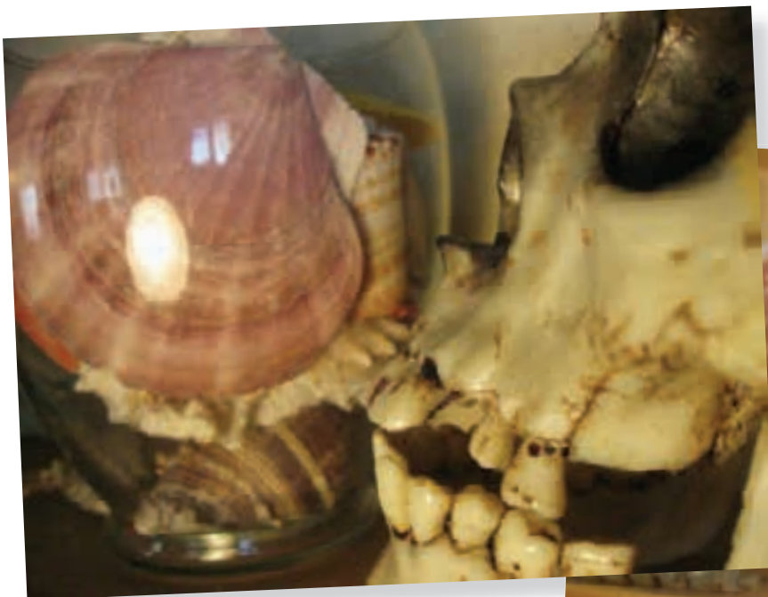
Foto's van het rariteitenkabinet van de schrijver

Mijn oudste zoon heeft een eigen kabinet. Hij noemt dat zijn 'doos met gekke dingen' en die zit vol ongewone spullen die hij op zijn wandelingen vindt. Die doos bevat een oude slangenhuid, een grote dennenappel, een zware metalen veer die ooit waarschijnlijk in een auto heeft gezeten en een vreemd gevormd stuk boomschors.