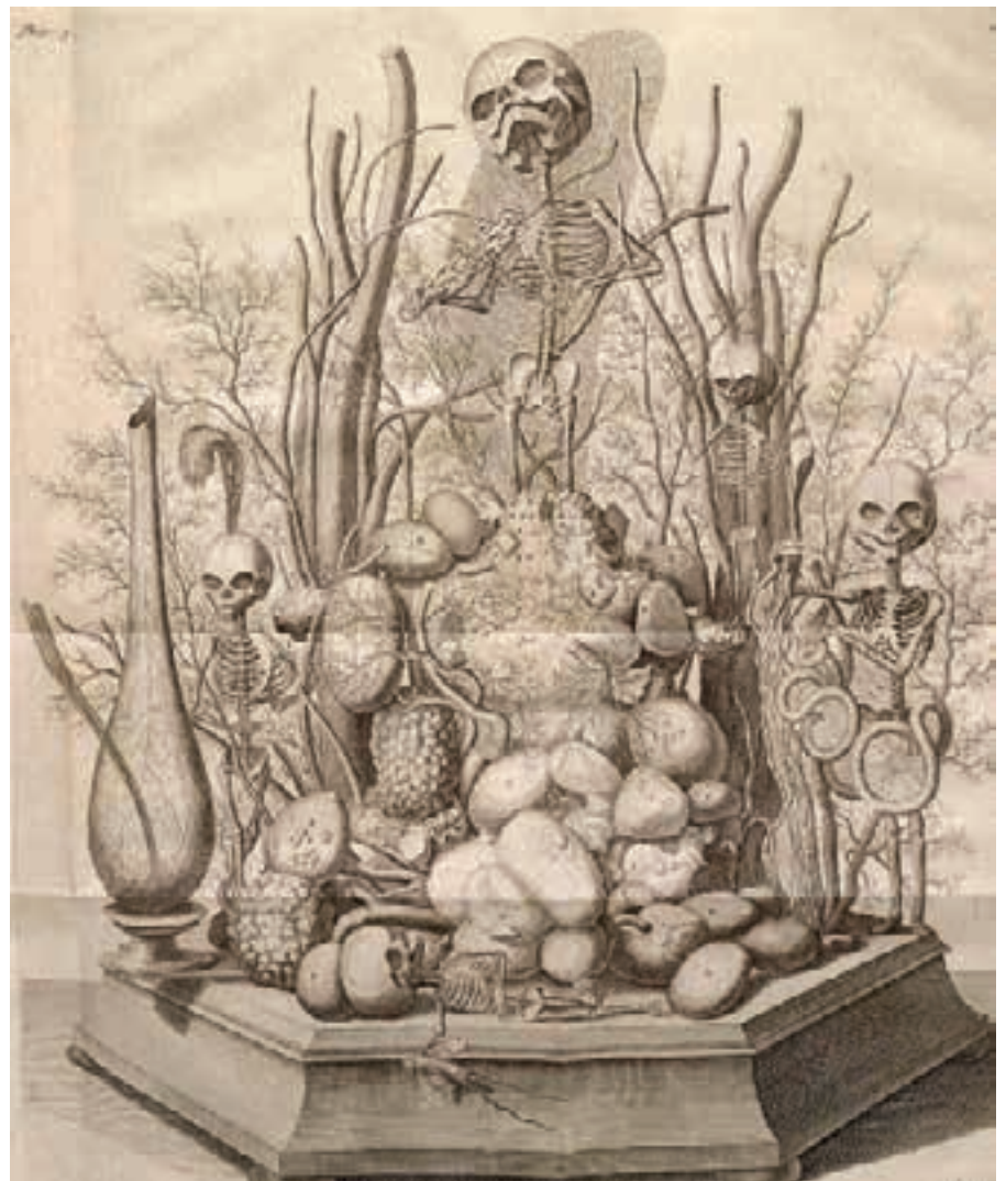
Tekening van een diorama uit de anatomische curiositeitscollectie van Frederik Ruysch. Zo'n diorama bestond vaak uit delen van menselijke lichamen.

Ook de geneeskunde is de rariteitenkabinetten veel dank verschuldigd. Veel verzamelaars waren niet alleen geïnteresseerd in biologie en de anatomie van het leven op aarde, maar ook in het menselijk lichaam. Wij vinden het nu misschien een beetje gek, maar veel mensen hadden ook doodshoofden en andere menselijke botten in hun verzameling. Dat heeft artsen geholpen het menselijk lichaam beter te begrijpen. Frederik Ruysch, een Nederlandse arts uit de zeventiende eeuw, ontleedde lichamen in het bijzijn van studenten en toeschouwers, zodat ze meer over geneeskunde konden leren. Van de geraamten die hij aan die autopsieën overhield, legde hij verzamelingen aan die als versiering dienst konden doen.