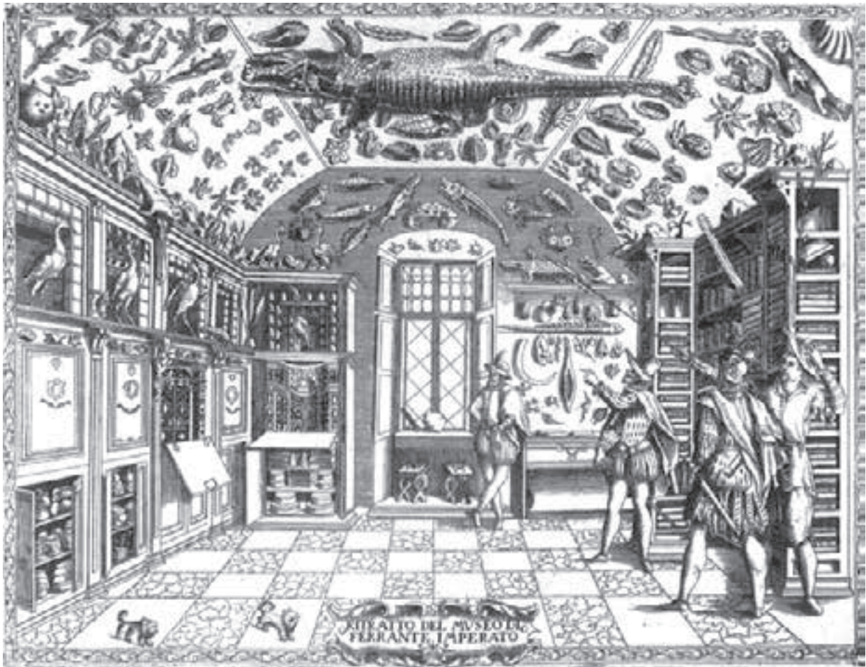
Deze gravure uit Dell'istoria naturale van Ferrante Imperato (Napels, 1599) geeft een van de oudste bekende verzamelingen van voorwerpen uit de natuur in Europa weer.

een 'kamertje'. Dat werd geleidelijk een plek waar dingen werden opgeslagen en kon zo klein als mijn sigarenkistje of zo groot als een heel huis zijn. Kabinetten besloegen soms zelfs meerdere huizen; ze vormden de basis voor wat wij nu een museum noemen. Kabinetten verwierven hun grootste populariteit in het tijdperk van de grote ontdekkingen. Dat is de periode van de vroege vijftiende tot de late zeventiende eeuw, toen mensen uit Europa eropuit trokken en de rest van de wereld ontdekten: Afrika, Azië, Australië, Amerika en de eilanden in de Grote Oceaan. De naam 'tijdperk van de grote ontdekkingen' is eigenlijk misleidend, want die plekken waren al ontdekt door de mensen die er toen leefden. Maar voor de Europeanen waren ze wel nieuw. De Europeanen brachten allerlei waardevols mee terug, zoals goud, zilver en specerijen, maar ook raadselachtige dingen, zoals planten, dieren, stenen, fossielen, beenderen en edelstenen die ze nog nooit gezien hadden. Rijke Europeanen gingen die onbekende dingen verzamelen en bouwden er speciale kasten voor. Ze wilden die