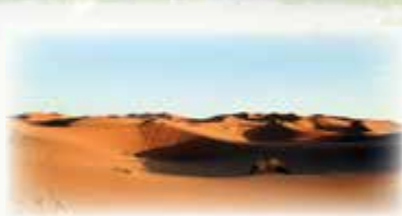
De Sahara, eindeloze zandvlaktes in Marokko