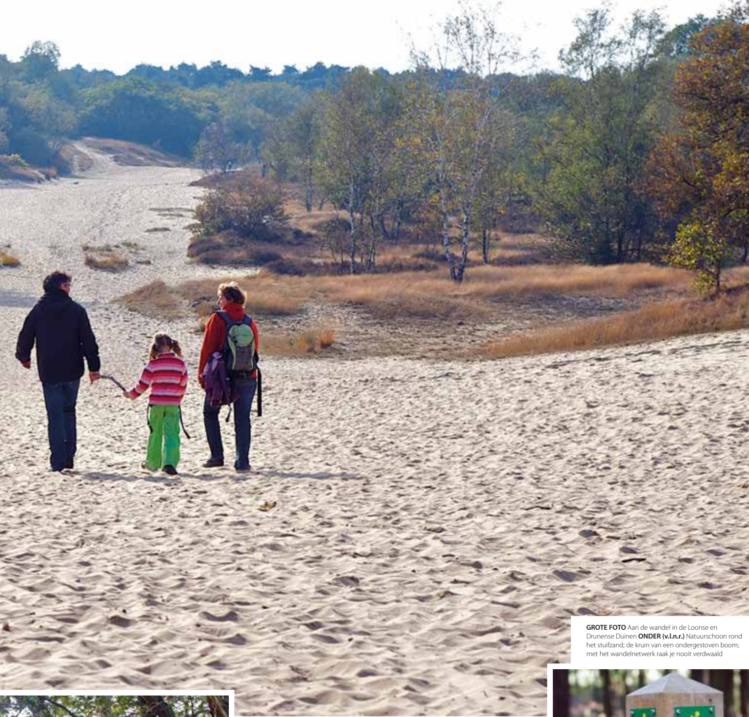
GROTE FOTO Aan de wandel in de Loonse en Drunense Duinen ONDER (v.l.n.r.) Natuurschoon rond het stuifzand; de kruin van een ondergestoven boom; met het wandelnetwerk raak je nooit verdwaald