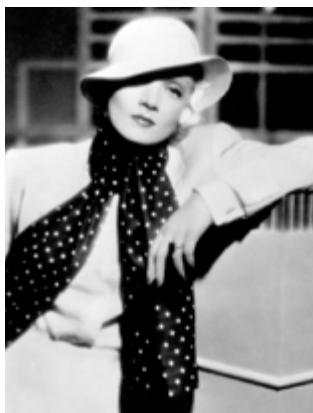
Actrice Marlene Dietrich