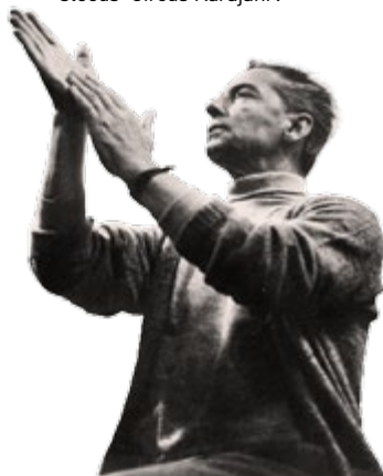
Dirigent Herbert von Karajan

Deze beroemde Oostenrijkse dirigent (1908–1989) stond van 1954 tot 1989 aan het hoofd van de Berliner Philharmoniker. Onder zijn leiding ontwikkelde het orkest een geheel eigen geluid, dat tot op heden geroemd wordt. Herbert von Karajan werd zowel geacht als gevreesd door zijn musici: hij was geniaal, maar ook heetgebakerd. De Berlijners noemen de Philharmonie nog steeds 'Circus Karajani'.