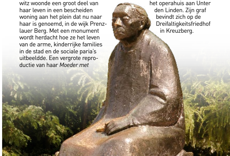
Monument voor beeldhouwster en schilderes Käthe Kollwitz door Gustav Seitz

Deze componist (1809–1847), een kleinzoon van filosoof Moses Mendelssohn, was dirigent van de Staatskapelle (staatskapel) van het operahuis aan Unter den Linden. Zijn graf bevindt zich op de Dreifaltigkeitsfriedhof in Kreuzberg.