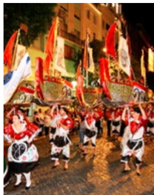
Processie tijdens het jaarlijkse Santo Antóniofestival

Op 12 en 13 juni viert Lissabon de dag van de H. Antonius. Er zijn pro-