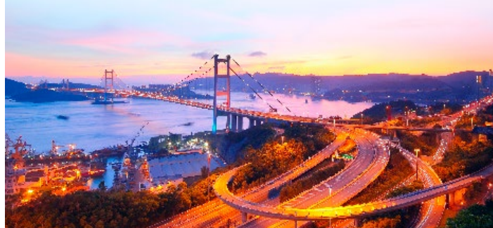
De Tsing Ma Bridge bij zonsondergang vanaf Tsing Yi

Deze hangbrug verbindt Tsing Yi Island met Lantau, en is 2,2 km lang. Een prachtig gezicht, vooral als hij 's avonds verlicht is. De dubbele brug vormt de weg- en treinverbinding naar vliegveld Chek Lap Kok. Hij werd in mei 1997 geopend door Margaret Thatcher, de bouw heeft vijf jaar geduurd en hij heeft HK$ 7,14 miljard gekost. Neem de MTR naar Tsing Yi of een bus naar het vliegveld (geen trein). Er is ook een uitzichtspunt bij Ting Kau (blz. 120).