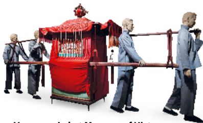
Voorwerp in het Museum of History

zijn hotels – het Langham, het Peninsula, het InterContinental – met ontzagwekkende luxe. En in de kolossale winkelcentra in Harbour City vindt u ieder product en iedere service die een mens maar kan bedenken.