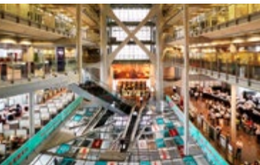
Atrium van HSBC Headquarters

Het opvallende gebouw van sir Norman Foster heeft HK$ 5,2 miljard gekost en was daardoor bij de opening in 1985 een van de duurste gebouwen ter wereld. Dit hoofdkantoor van Hong Kong and Shanghai Banking heeft bijna de beste feng shui in de buurt, want het staat op het trefpunt van vijf drakenlijnen, en het uitzicht op de haven is onbelemmerd. Het atrium voelt met zijn natuurlijke licht als een kathedraal. Bij de ingang staan twee leeuwen, Stephen en Staan.