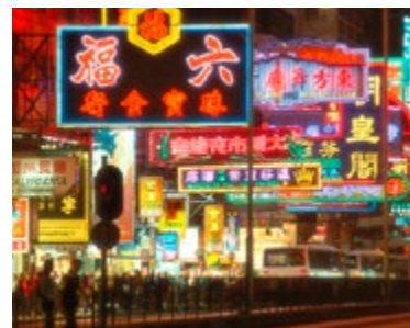
Neonverlichting op de Golden Mile

Het nieuwste snuffje op het gebied van luxe accommodatie en service. Dit deftige hotel lijkt wel een oude dame die kalm over het duizelingwekkende silhouet van Hong Kong kijkt. De prijzen van de goedkoopste kamer beginnen waar die van veel andere luxehotels stop