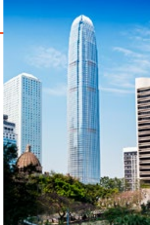
Two IFC Tower

De Two International Finance Centre Tower rijst ver boven Victoria Har-