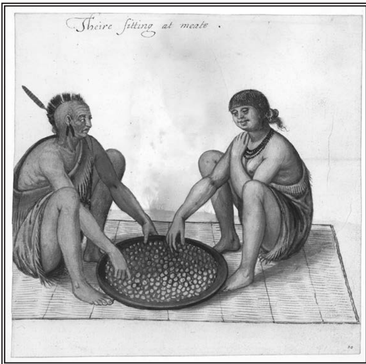
Figuur 1.1 John White, Aquarel van indiaans echtpaar aan de maaltijd (1585–1586). British Museum.

Na Whites terugkeer in Engeland vroeg Sir Walter Raleigh (die van koningin Elizabeth een koninklijke vrijbrief had gekregen om niet-christelijke landen te verkennen en te koloniseren) hem opnieuw een expeditie te organiseren en benoemde hem tot gouverneur. De voorraden voor de ruim honderd kolonisten begonnen te slinken en conflicten met inheemse stammen brachten de onderneming in gevaar. White voer naar Engeland om voorraden in te slaan maar bij zijn terugkomst vijf jaar later, die vertraagd was wegens conflicten met Spanje en de nederlaag van de Spaanse Armada, was er geen spoor van de nederzetting meer te bekennen.