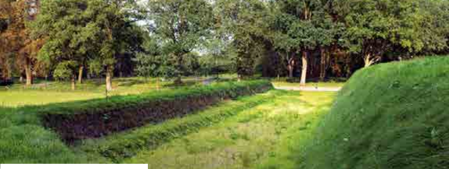
De Ommerschans tussen Ommen en Balkbrug