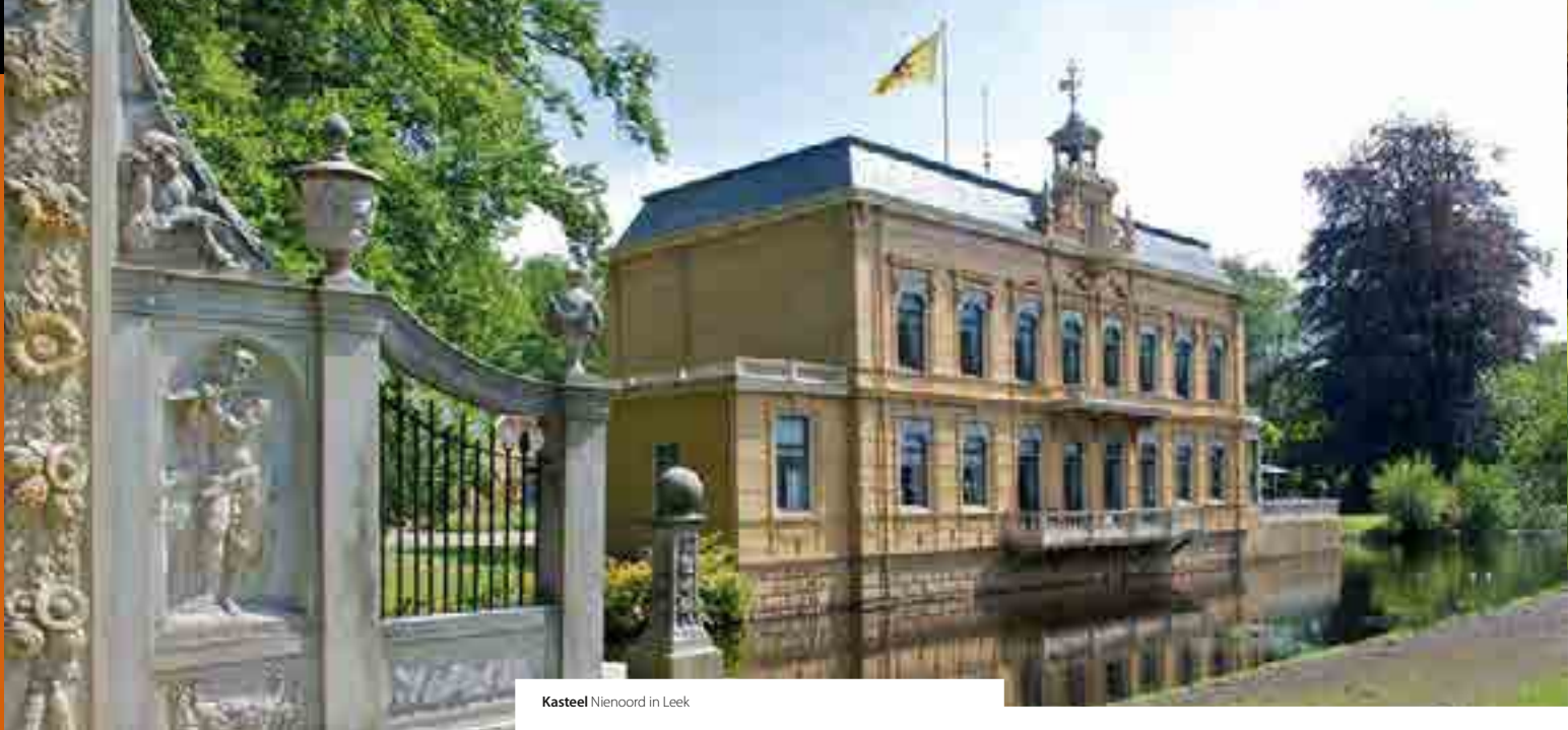
Kasteel Nienoord in Leek