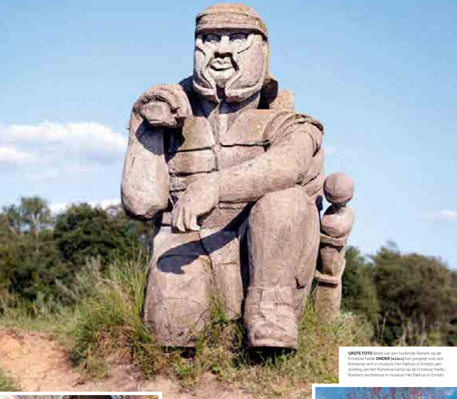
GROTE FOTO Beeld van een hurkende Romein op de Ermelose heide ONDER (v.l.n.r.) Een jongetje voor een Romeinse tent in museum Het Pakhuis in Ermelo; aanduiding van het Romeinse kamp op de Ermelose heide; Romeins vechtteneu in museum Het Pakhuis in Ermelo