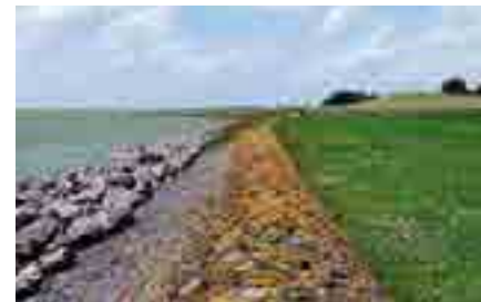
De Rode Klif

wachten op de juiste wind bereikt de vloot de Friese kust. Daar splitst het leger zich; Willem belandt noordelijk van Stavoren, zijn oom, hertog Jan van Beaumont ten zuiden.