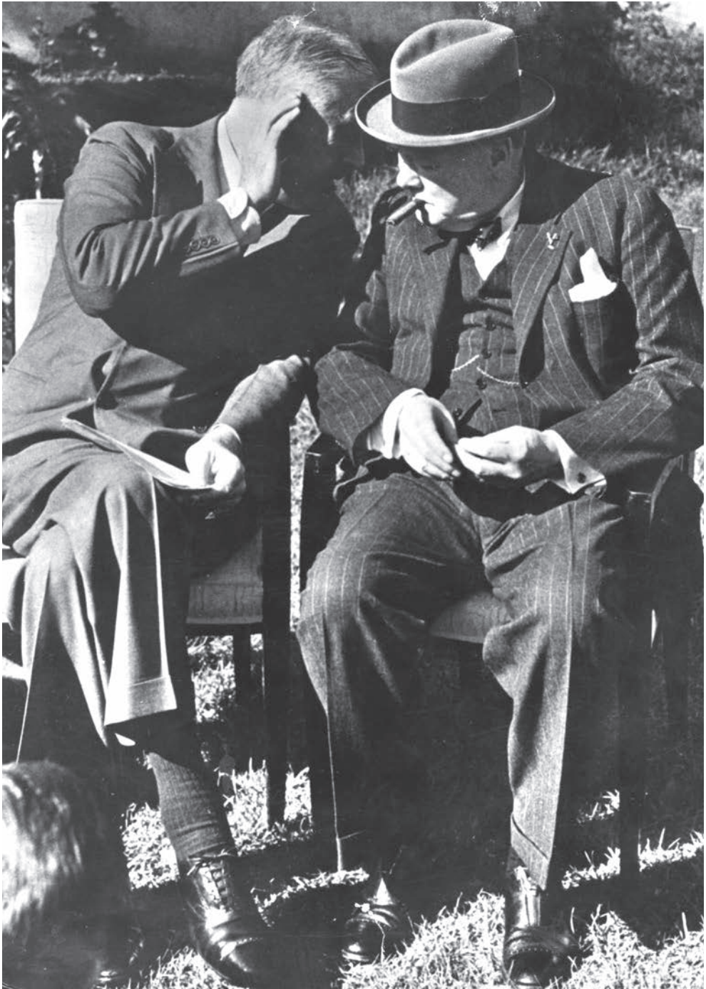
Onderonsje tussen de Amerikaanse president Franklin D. Roosevelt (links) en de Britse minister-president Winston Churchill tijdens de Conferentie van Casablanca, januari 1943.