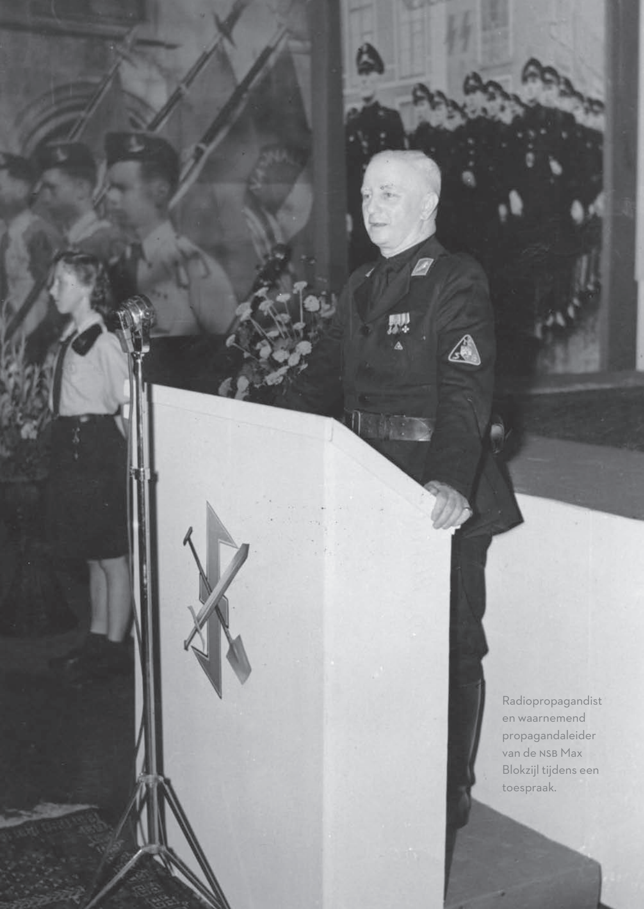
Radiopropagandist en waarnemend propagandaleider van de NSB Max Blokzijl tijdens een toespraak.