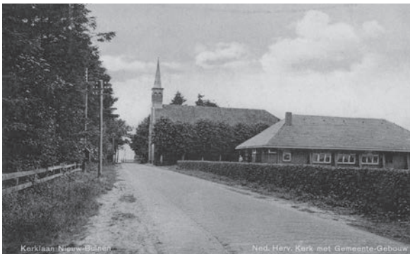
Nieuw-Buinen, rond 1940. De hervormde kerk met het gemeentegebouw aan de Kerklaan.

Hoewel hij in zijn redevoering benadrukt dat geweld en vernielingen uit den boze zijn, gaan die nacht de ruiten van enkele plaatselijke nsb'ers aan diggelen. Daarnaast