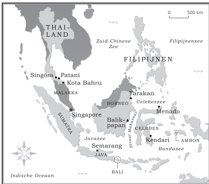
De eerste Japanse landingen.

de kantoorbelangen te behartigen. ‘Dit beperkte zich evenwel vrijwel tot de mededeling aan onrustige cliënten, dat de heren er niet waren en dat het geheel onzeker was, wanneer zij zouden terugkomen.’ Ondertussen verliep de oorlog voor de Japanners zeer voorspoedig. Op 10 december 1941 was de Britse Eastern Fleet een zeer gevoelige nederlaag toegebracht met het tot zinken brengen van de slagschepen HMS Repulse en HMS Prince of Wales . Britse divisies op Malakka werden steeds verder teruggedreven richting het eiland van Singapore, dat ook in handen van de Britten was. In de ogen van de geallieerden was dat een onneembare vesting. De Filipijnen vielen en van daaruit begonnen de Japanners aan hun opmars door de buitengewesten van de Nederlands-Indische archipel. De haven van Tarakan bij Noord-