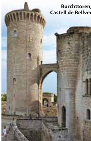
Burchtoren, Castell de Bellver