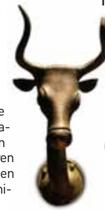
Votiefbeeld, Museum de Malloorca

Deze schatkamer in het voormalige bisschoppelijk paleis toont talloze archeologische vondsten, keramiek,