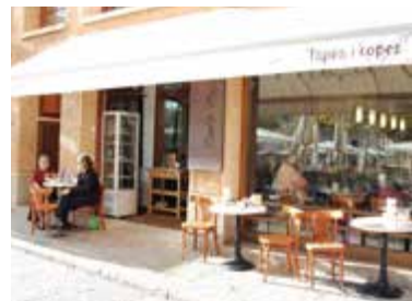
Terras van Café Plaça

Smul van lokale tapas, waaronder gefrituurde calamari of vers gegrilde pijnklivis, op het terras dat een prima plek vormt op het plein.