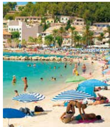
Badgasten bij Port del Sóller

Hoewel het bijna wordt opgeslokt door Cala d'Or (blz. 122) is dit vissersdorpje er tot nu toe in geslaagd om zijn authentieke sfeer te behouden – mogelijk omdat er geen strand is. U kunt er rondwandelen en de hellingen met villa's en de boten in het jachthaventje bewonderen. Er is slechts één hotel, dat een goede uitvalsbasis is om het eiland te verkennen.