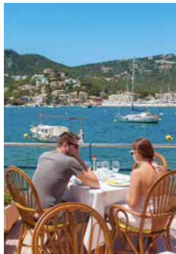
Buiten lunchen, Port d'Andratx

Deze gezinsvriendelijke badplaats ligt 6 km ten noordoosten van Pollença aan een aangename baai. Het is een fijne plek met een lang zandstrand. Veel buitenlandse pensionado's zijn hier permanent gaan wonen (blz. 110).