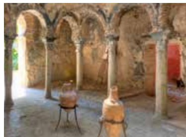
Het tepidarium in de Banys Àrabs

Kaart N5 ■ C/de la Portella 5 ■ 971-177838 ■ Open di–za 10.00–19.00, zo 10.00–14.00 uur ■ Niet gratis Het is de entree meer dan waard om het gebouw van binnen te zien, een 17de-eeuws paleis op de fundamenten van een van de oudste Moorse huizen van Mallorca. Het boeiende museum geeft een beknopt overzicht van Mallorca van de prehistorie tot de 20ste eeuw. Behalve schatten uit de Romeinse tijd zijn er imposante reconstructies van tomben en woningen uit het neolithicum en de bronstijd. Er zijn ook prachtige exemplaren van modernistameubilair te zien – met name een console met een gewaagd asymmetrisch ontwerp (blz. 51).