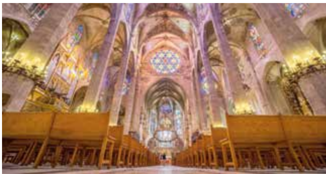
Het imposante schip en de gebrandschilderde ramen van La Seu