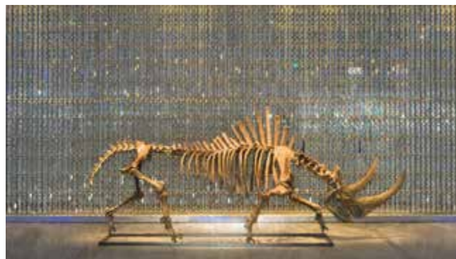
Expositie in het Fundación Yannick y Ben Jakober

Te midden van een mooie rozentuin en beeldenpark ziet u dit museum met eigentijdse kunst en koninklijke kindportretten uit de 16de–19de eeuw.