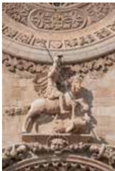
Basilica de Sant Francesc

In 1983 werd Palma de hoofdstad van de nieuwe Autonome Gemeenschap van de Balearen en groeide van een provincie-stad uit tot een bloeiende metropool. Nu heeft de stad ruim 400.000 inwoners. Het is een bekoortlijke plek; Jaume I zou in 1229 na de verovering ervan hebben gezegd dat het de 'mooiste stad was die hij ooit gezien had'. Het is aangenaam slenteren door de schone, aantrekkelijke straten langs gerenoveerde gebouwen. De stad en de haven zijn gezellig, met talloze bars en restaurants die druk worden bezocht.