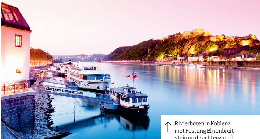
↑ Rivierboten in Koblenz met Festung Ehrenbreitstein op de achtergrond