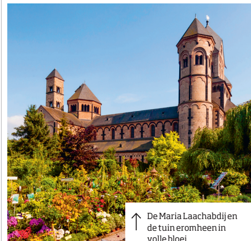
↑ De Maria Laachabdij en de tuin eromheen in volle bloei

De abdij van Maria Laach, een fraai voorbeeld van Duitse en Europese romaanse architectuur, ligt aan de Laacher See, een meer dat is ontstaan in de krater van een uitgewerkte vulkaan. In 1093 begon men, in opdracht van Heinrich II, die er begraven is, met de bouw. De abdij werd pas in 1220 voltooid. Tot de secularisatie in 1802 huisden hier benedictijner monniken. Sinds 1892 zijn er enkele malen per dag weer gregoriaanse gezangen te horen.