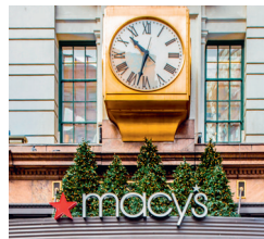
↑ De pui van Macy's, met het bekende logo: een rode ster

hattan Opera House, dansza- len en horecagelegenheden zorgden voor veel reuring, tot hervormers daar rond 1900 paal en perk aan stelden. Het enige wat nog over is van het Herald Building is de Bennett Clock, genoemd naar James Gordon Bennett Jr., uitgever van de Herald . Het operahuis werd in 1901 gesloopt om plaats te maken voor Macy's en daarna verre- zen er ook andere warenhui- zen, waardoor het plein een mekka voor shoppers werd. De nu verdwenen Gimbel Brothers Department Store