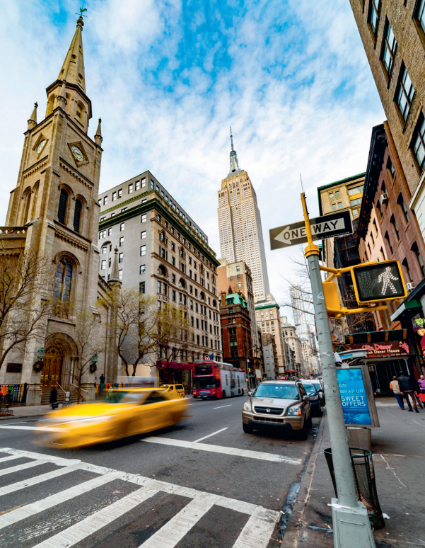
← De Marble Church aan Fifth Avenue, met op de achtergrond het Empire State Building