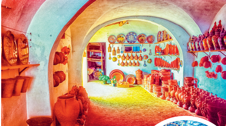
Aardewerkwinkel in Caldas da Rainha met plaatselijke keramiek (inzet) ↑