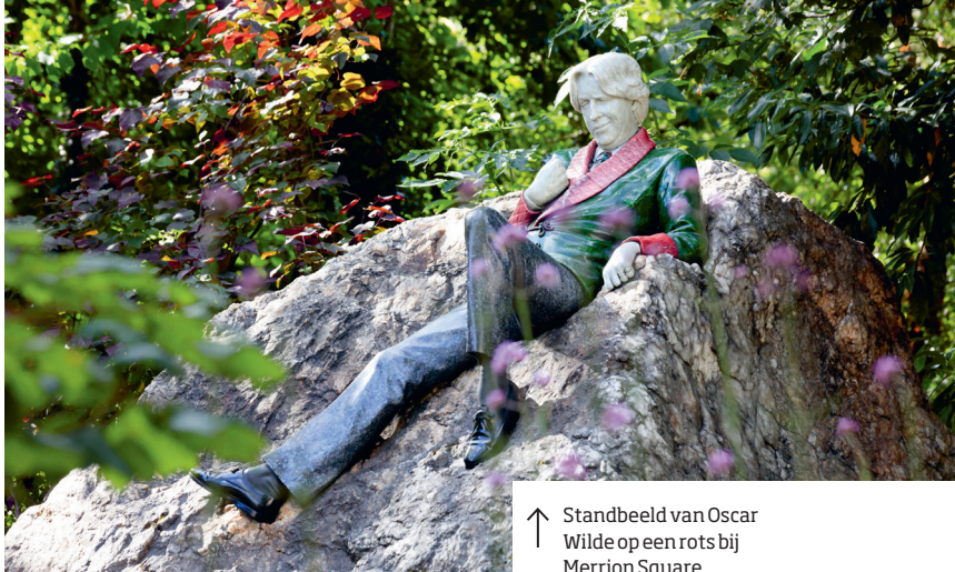
↑ Standbeeld van Oscar Wilde op een rots bij Merrion Square