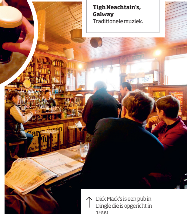
↑ Dick Mack's is een pub in Dingle die is opgericht in 1899

De 'etiquette' in Ierse pubs is informeel, maar het geven van rondjes is wel gebruikelijk. Als u een rondje accepteert, zult u er, om geen scheve gezichten te krijgen, ook een moeten weggeven. Sla een aangeboden drankje op vriendelijke wijze af als u niet te lang wilt blijven plakken.