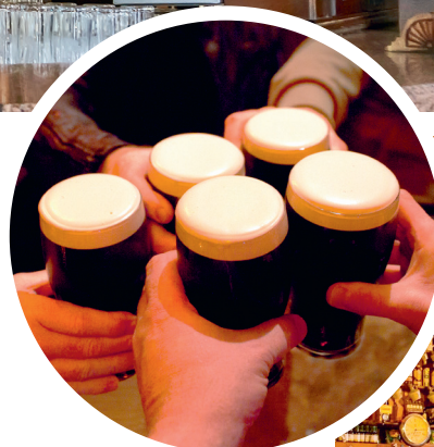
↑ Guinness, het bier met de karakteristieke volle, romige schuimkraag.