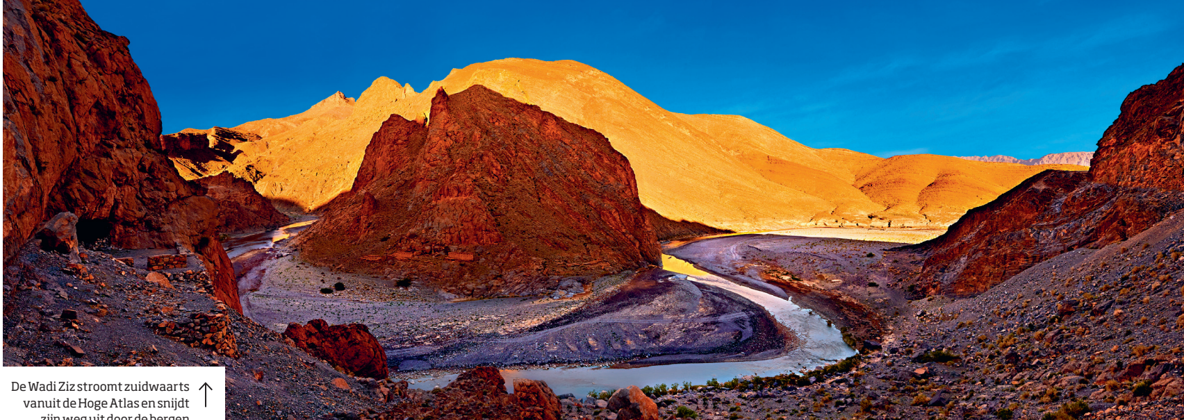
De Wadi Ziz stroomt zuidwaarts vanuit de Hoge Atlas en snijdt zijn weg uit door de bergen ↑