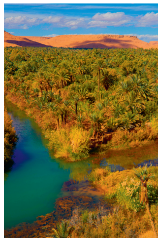
↑ De Wadi Ziz voedt de dorstige palmbomen in de oase Tafilalt

maken bossen plaats voor dorre vlakten. Langs de weg liggen de versterkte dorpen van de Ait Idzergstam en een paar oude forten van het Franse Vreemdelingenlegioen. De Tunnel de Foum-Zabel, of Tunnel du Légionnaire, is in 1927 door het Vreemdelingenlegioen in het kalksteen uitgehakt, waarmee een route naar het zuiden ontstond. De tun-