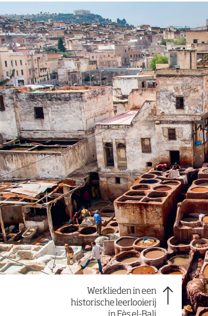
Werklieden in een historische leerlooierij in Fès el-Bali

De best behouden gebleven en meest uitgestrekte medina van Marokko vindt u in Fès el-Bali, het oude Fès. Het lijkt misschien één grote chaos, maar er zit een systeem achter. In het midden staat de grote moskee, elke religieuze en etnische groep heeft een eigen wijk en activiteiten zijn geordend volgens een sociale en commerciële hiërarchie. Toch zal elke bezoeker die hier voor het eerst komt onherroepelijk verdwalen, maar dat maakt deel uit van de ervaring.