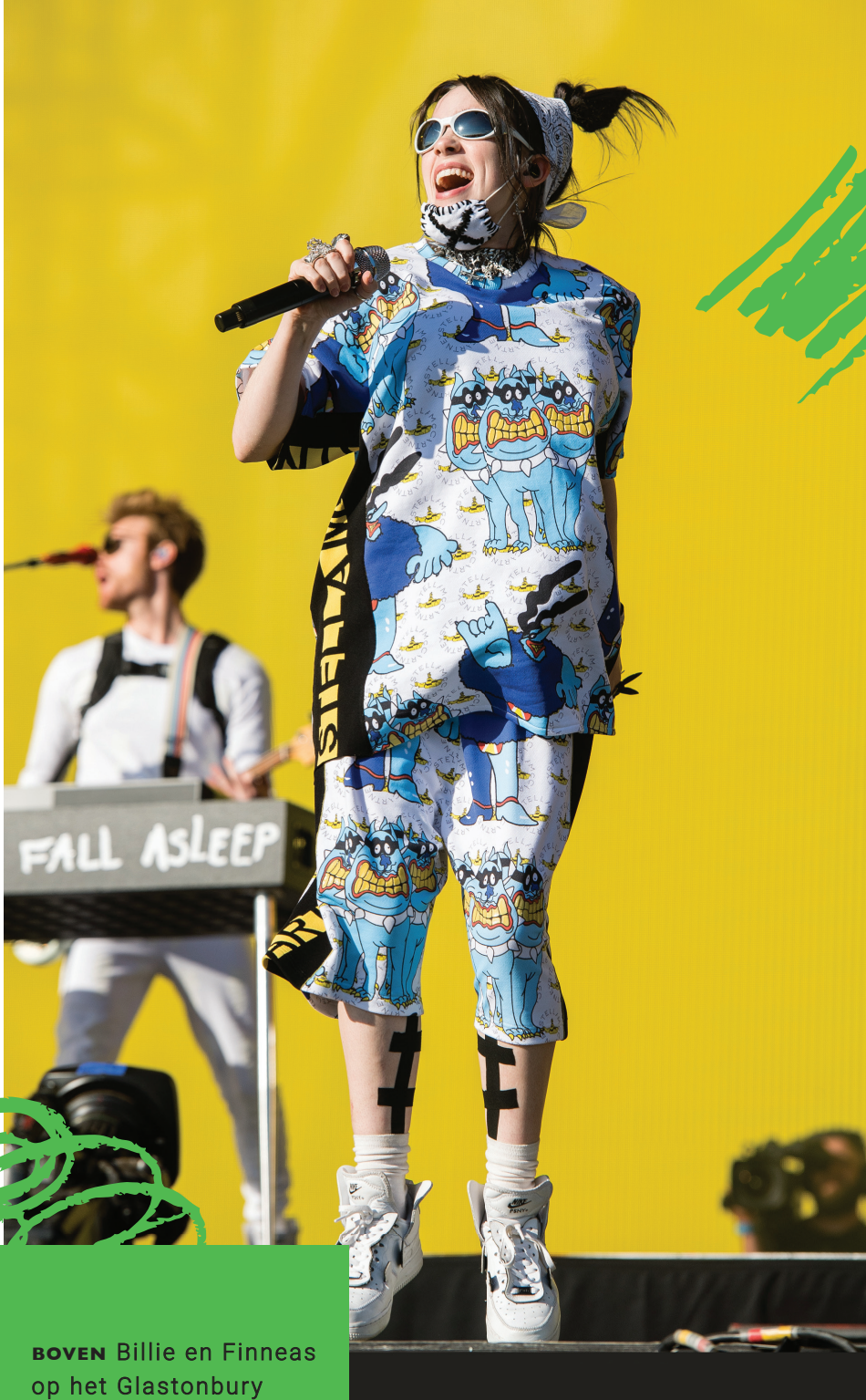
BOVEN Billie en Finneas op het Glastonbury Festival in 2019.