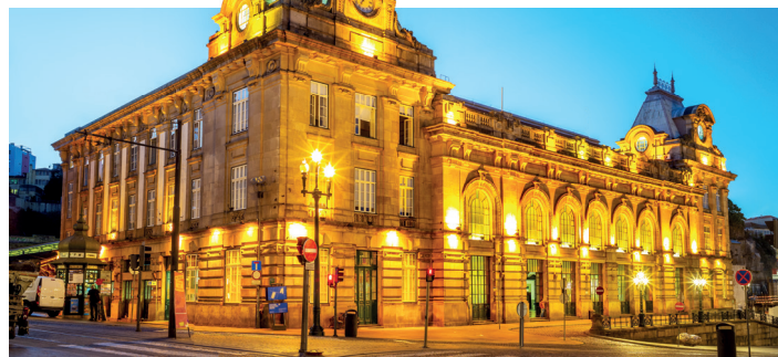
Het verlichte exterieur van het Estação de São Bento bij avond

Met de opening van het prachtige treinstation van Porto in 1916 betrad de stad eindelijk de 20ste eeuw. Van buiten lijkt station São Bento op de krachtige architectuur van Frankrijk tijdens de belle époque. Van binnen is het echter een glorieus feest van Portugese decoratieve kunst, met een galmende hal met loketten waar de muren bedekt zijn met ingewikkelde azulejos.