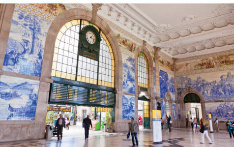
De grote hal van het Estação de São Bento