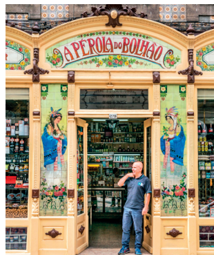
Ingang van A Pérola do Bolhão

De art-nouveaugevel van deze kruidenierszaak (blz. 75) is voorzien van kleurrijke tegels die portretten vormen van Indiase en Afrikaanse vrouwen. Ze symboliseren de thee en koffie die uit de koloniën van Portugal werden geïmporteerd en die hier sinds 1917 werd verkocht aan de bevolking van Porto.