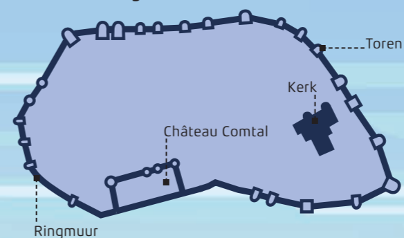
Plattegrond Carcassonne, 1209

De ringmuur rond Carcassonne was meer dan een kilometer lang.