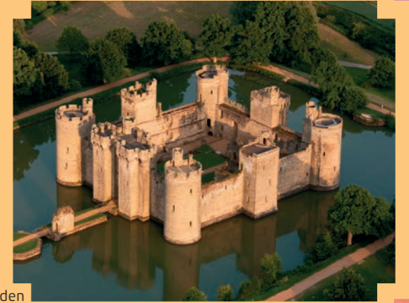
Bodiam Castle, heden

Wist je dat? Door de weerspiegeling in de slotgracht leek het kasteel groter dan het was.