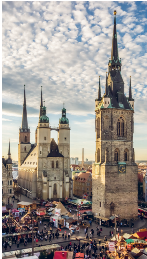
Boven: statige torens bij het marktplein in het oude centrum van Halle midden in Duitsland.

wordt gesierd door kustlandschappen en historische steden. Het Spaanse netwerk van snelle treindiensten brengt je vroeg of laat naar het knooppunt Madrid Atocha. Ten zuiden van Madrid snijdt de AVE door het droge hart van het land, tot de olijfgaarden van Andalusië verschijnen. Na Córdoba met zijn grandioze moskee-kathedraal splitst