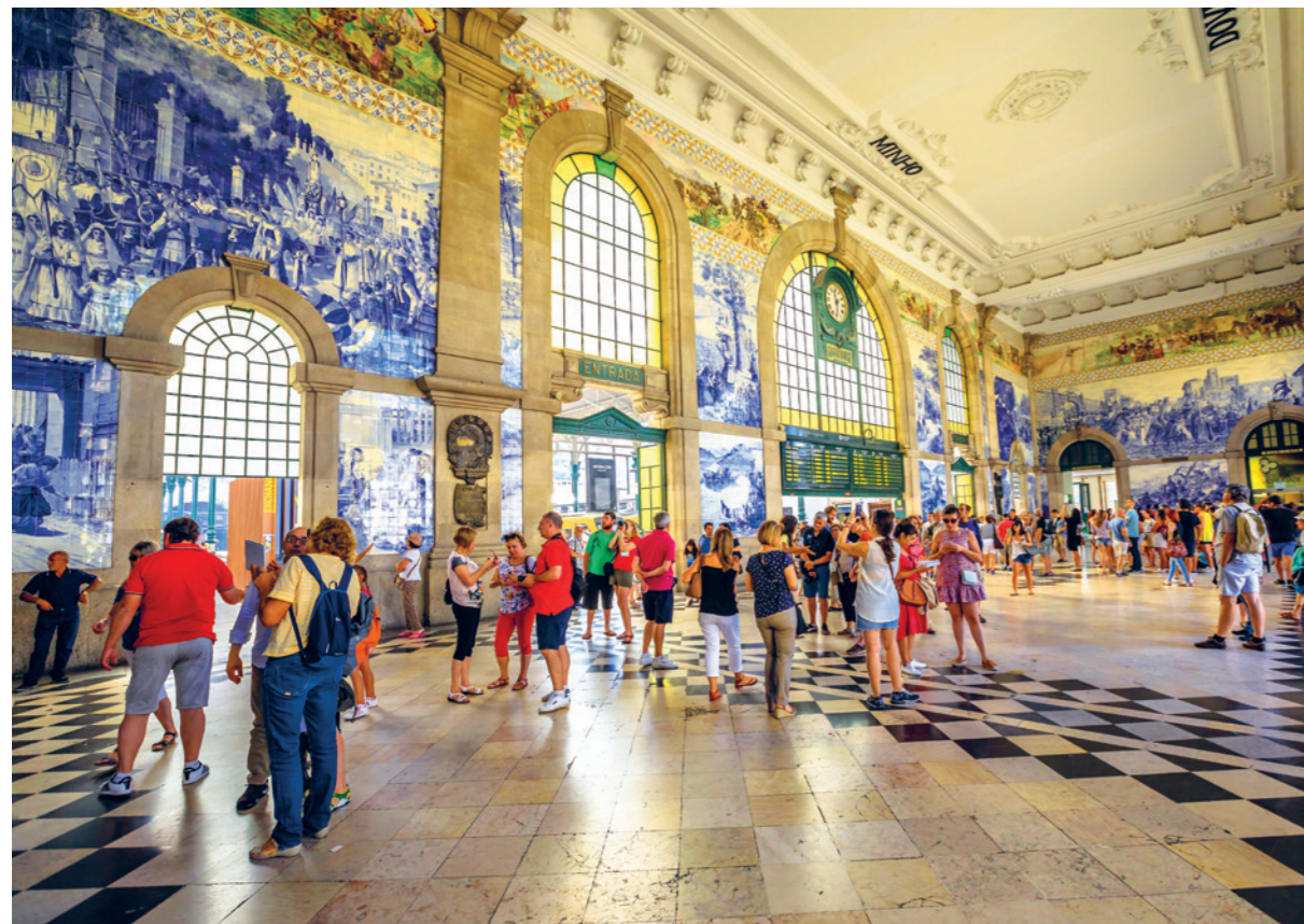
Boven: het adembenemende interieur van station São Bento in Porto, bekleed met traditionele Portugese azulejo-tegels.

Vaak word je op magische wijze dwars door nieuwe wijken recht naar het centrum geleid, naar een station in het kloppend hart van de stad. De grootste stationsarchitecten begrepen dit. Wat zij bouwden, waren geen verkeersknooppunten maar tempels, versierd met beelden en met gewelven als van een kathedraal. Deze stations staan er nog steeds, als sprookjesachtige portalen die de voorbode zijn van een wereld van