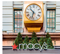
↑ De pui van Macy's, met het bekende logo: een rode ster

hattan Opera House, dansza- len en horecagelegenheden zorgden voor veel reuring, tot hervormers daar rond 1900 paal en perk aan stelden. Het enige wat nog over is van het Herald Building is de Bennett Clock, genoemd naar James Gordon Bennett Jr., uitgever van de Herald . Het operahuis werd in 1901 gesloopt om plaats te maken voor Macy's en daarna ver- rezen er ook andere waren- huizen, waardoor het plein een mekka voor shoppers werd. De nu verdwenen Gimbel Brothers Department Store