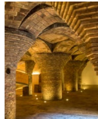
Gewelven van Palau Güell

Het gebruik van paraboolbogen om de ruimte in te delen ( blz. 87 ) is een voorbeeld van Gaudí's structuur-experimenten. Ook paste hij ongewone materialen toe als ebbenhout en zeldzaam Zuid-Amerikaans hout.