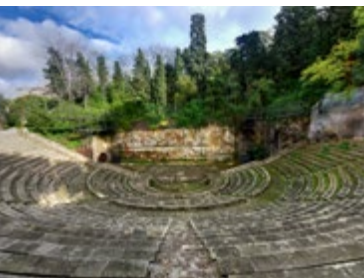
Het sfeervolle Teatre Grec