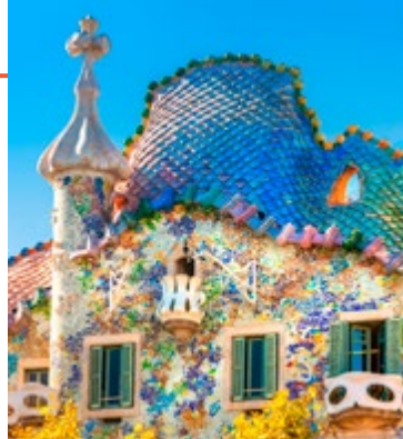
Het kleurrijke uiterlijk van Casa Batlló

Kaart E2 ■ Pg de Gràcia 43 ■ Open dag 9.00–21.00 uur ■ Niet gratis (audiogids) ■ www.casabatllo.es Casa Batlló ( blz. 107 ) op La Mansana de la Discòrdia illus-