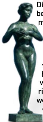
Beeld, Castell de Montjuïc

Dit grote park, 'Joodse berg' genoemd, naar een belangrijke Joodse begraafplaats die hier in de middeleeuwen lag, werd aangelegd voor de Wereldtentoonstelling van 1929, toen ook het Palau Nacional en het Mies van der Rohe-paviljoen werden gebouwd. Toen het gebied niet meer gebruikt werd, raakte het ernstig in verval. Het kasteel heeft een grimmig verleden: het was jarenlang de executielocatie van Franco's vuurpelotons, maar nu is Montjuïc een belangrijke toeristische trekpleister in Barcelona. Vanwege de Olympische Spelen van 1992 werd het een prachtige groene oase, met mooie musea en sportfaciliteiten, verbonden door een netwerk van buitenroltrappen en rustige, lommerrijke tuinen.