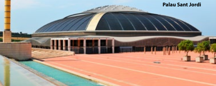
Palau Sant Jordi

De ster van de Olympische faciliteiten is dit stalen en glazen overdekte stadion (niet toegankelijk) annex multifunctionele installatie van de Japanse architect Arata Isozaki. Het stadion heeft 17.000 plaatsen en is thuisbasis van de basketbalploeg van de stad. De esplanade – een surreëel woud van beton- en metaalpilaren – is ontworpen door Aiko Isozaki, echtgenote van Arata. Lager op de heuvel liggen de Olympische binnen- en buitenzwembaden van Bernat Picornell, beide gesloten voor het publiek.