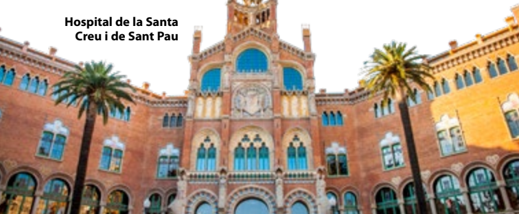
Hospital de la Santa Creu i de Sant Pau

In scherp contrast met het strakke rasterpatroon van de Eixample werd dit ambitieuze project ( blz. 107 ) gepland rond twee