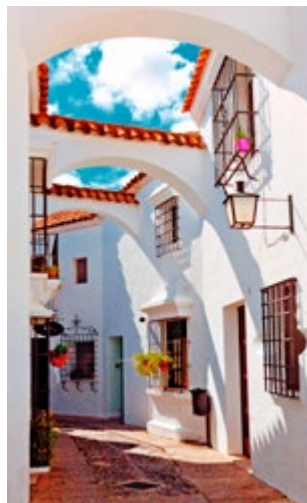
Traditionele steeg, Poble Espanyol

In dit Spaanse poble (dorp) zijn bekende gebouwen en straten uit heel Spanje op ware grootte nagebouwd. Poble Espanyol is een centrum voor kunst en ambacht, inclusief een atelier voor glasblazers. Het is een van de populairste attracties van de stad. Er zijn veel winkels met lokale ambachtelijke producten en restaurants en cafés.