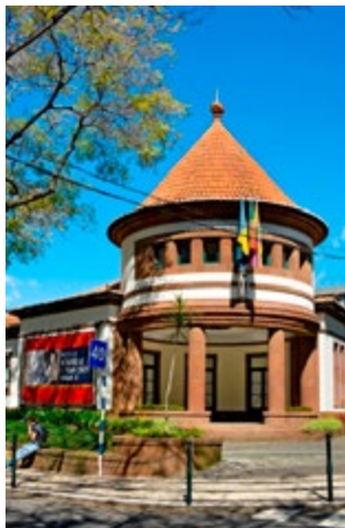
Museu Henrique e Francisco Franco