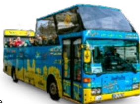
Toeristenbus, Porto Santo

De twee uur durende tour in een toeristenbus vertrekt dagelijks om 14.00 uur vanaf de bushalte bij het benzinstation aan de oostkant van de pier.