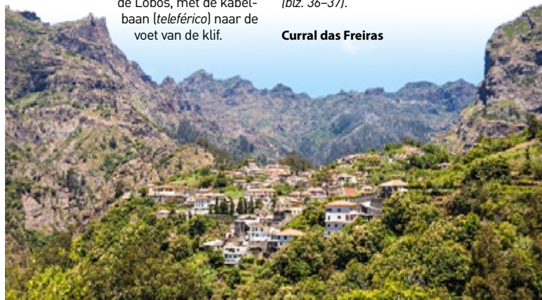
Curral das Freiras

Tegenwoordig verbindt een lange tunnel het valleidorp Curral das Freiras met de wijde wereld, omdat de oude weg uit veiligheids- overwegingen gesloten is. In het dorp krijgt u meteen een idee van hoe geïsoleerd het indertijd lag (blz. 36-37).