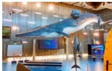
Blauwe vinvis in het Museu da Baleia

Galerie met werk van onder meer Picasso en Francis Bacon.