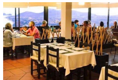
Panorama Restaurant met uitzicht

Met het romantische uitzicht is dine- ren hier een unieke gebeurtenis.