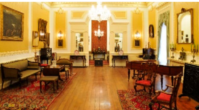
Casa Museu Frederico de Freitas