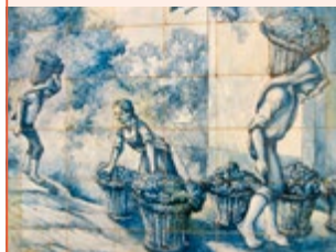
Tegels bij Blandy's Wine Lodge