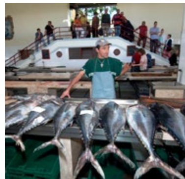
Tonijn op de vismarkt

Boven, in het domein van de fruit- en groenteverkopers, liggen de kramen vol met de kleurrijke, geurige oogst die net is binnengehaald uit de streek. Terwijl u een weg zoekt door de smalle padjes krijgt u soms een gratis stukje mango, passievrucht of bloedrode tomatillo aangeboden, in de hoop dat u dan blijft staan en iets koopt.