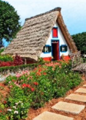
Traditioneel huis, Santana

Midden-Madeira bestaat vrijwel geheel uit hoge vulkanische pieken en diepe ravijnen. Wandelend beleeft u optimaal de grandeur van dit landschap, maar dankzij enkele mooie miradouros (panoramapunten) kunt u ook indrukwekkende foto's maken en genieten van de immense visuele aantrekkingskracht van het centrale gebergte als u met de auto rijdt. Noord en zuid contrasteren sterk. De zuidelijke hellingen, badend in de zon, zijn dichtbevolkt, met boerderijen met rode daken in een zee van wijnstokken en bananenbomen. De noordelijke hellingen zijn dichtbebost, en langs de kuststrook is terraslandbouw.