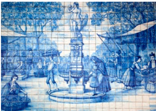
Beschilderde blauwe tegels met Leda en de zwaan