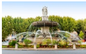
Fontein in Aix-en-Provence