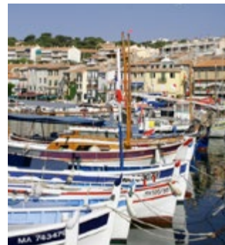
Het vissersdorp Cassis

9 Cassis Achter Cassis rijzen de hoogste kustkliffen van Frankrijk op, waardoor de haven en het oude centrum een knusse en intieme sfeer krijgen. De stranden trekken veel toeristen – de inhammen aan de westzijde zijn het leukst –, maar Cassis is en blijft een authentieke vissersplaats ( blz. 82 ).