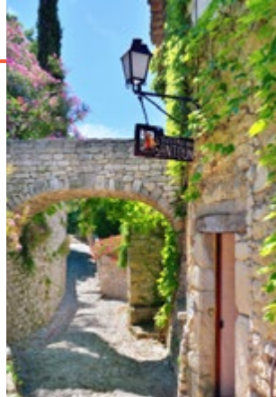
Keistenen straat in Séguret

4 Séguret Séguret ziet vanaf de uitlopers van de Dentelles de Montmirail uit over het weidse landschap. Het is een prachtig plaatsje, met autovrije straten, middeleeuwse gebouwen, hedendaagse kunstenaars en handwerkslieden ( blz. 129 ).