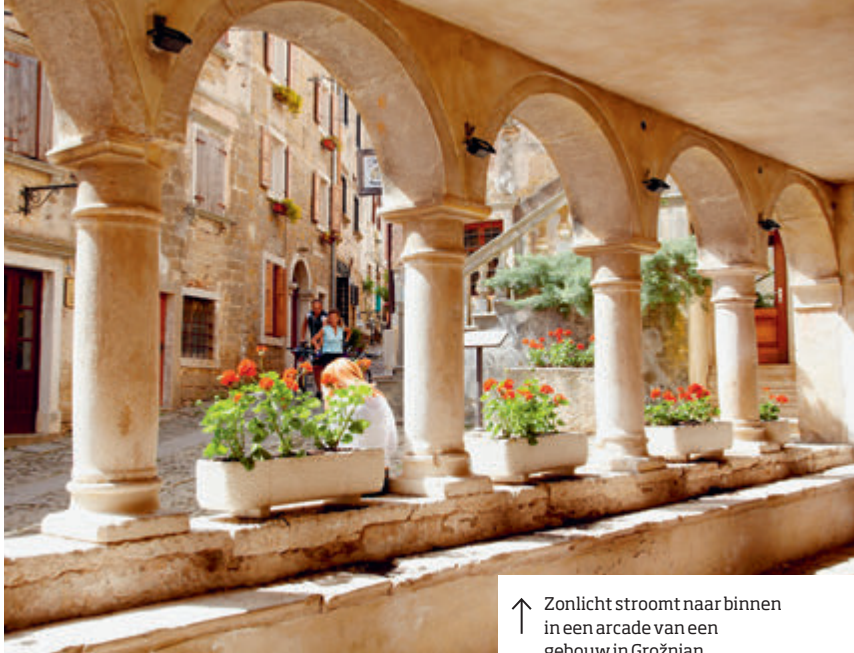
↑ Zonlicht stroomt naar binnen in een arcade van een gebouw in Grožnjan