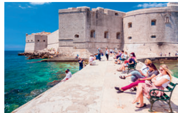
→ Genieten van het uitzicht naast het St. Jansfort

Naast het dominicanenklooster staat de Pločepoort (blz. 67), die naar de haven leidt. Goederen gingen naar en kwamen uit elke haven aan de Middellandse Zee.