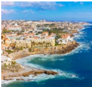
Promenade bij Cascais