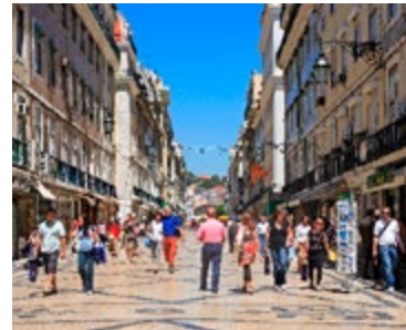
De gezellige Rua Augusta

Van de vroege 16de eeuw tot het midden van de 18de eeuw stond het koninklijke paleis in Lissabon aan de rivier, waar nu de Praça do Comércio is. Het was de grootse poort tot de wereldstad Lissabon. De aardschokken van 1755, gevolgd door een vloedgolf en een vuurzee, verwoestten het Paço Real en vrijwel alle middeleeuwse huizen erachter. De Baixa van heden is gebouwd op de ruïnes van die stad, in een andere stijl, voor een nieuwe tijd. Het is nu het aftakelende hart van Lissabon, dat het hoofd moet bieden aan ontvolking, verkeer, bodemverzakking en winkelcentra. Maar de nieuwe wijk is daarom niet minder geliefd.