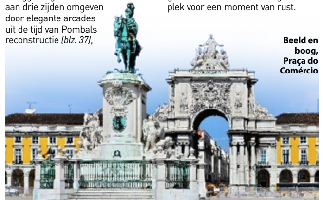
Beeld en boog, Praça do Comércio

De kerk lijkt wel een duistere spelonk, en hij wordt dan ook weinig door toeristen bezocht. Toch heeft de São Domingos (blz. 40) een lange geschiedenis en is het een goede plek voor een moment van rust.