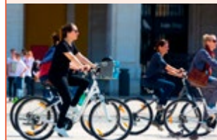
Fietsen in Lissabon