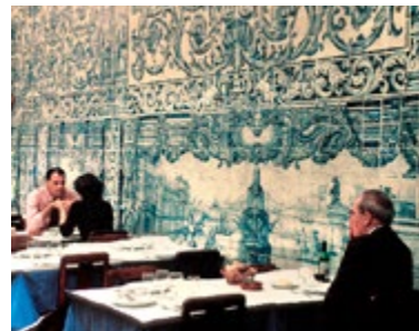
Interieur van Casa do Alentejo

7 Leão d'Ouro Kaart L3 ■ Rua 1 de Dezembro 105 ■ 213426195 ■ €€ Dit kathedraalachtige restaurant is inderdaad een tempel: voor vis. Supervers liggen ze in de vitrine.