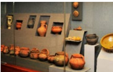
Vondsten in het Núcleo Arqueológico

Reserveer telefonisch een fascinerende gratis rondleiding door de kelders van de Millennium BCP-bank in de Baixa ( blz. 70 ). Bouwvakkers ontdekten de oude resten in de jaren negentig tijdens renovatiewerkzaamheden aan de bank en opgravingen onthulden Romeinse tanks waar vis in werd bewaard, Moors keramiek en christelijke graven.