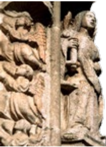
Snijwerk van Igreja da Conceição Velha

Van de vroege 16de eeuw tot het midden van de 18de eeuw stond het koninklijke paleis in Lissabon aan de rivier, waar nu de Praça do Comércio is. Het was de grootse poort tot de wereldstad Lissabon. De aardschokken van 1755, gevolgd door een vloedgolf en een vuurzee, verwoestten het Paço Real en vrijwel alle middeleeuwse huizen erachter. De Baixa van heden is gebouwd op de ruïnes van die stad, in een andere stijl, voor een nieuwe tijd. Het is nu het aftakelende hart van Lissabon, dat het hoofd moet bieden aan ontvolking, verkeer, bodemverzakking en winkelcentra. Maar de nieuwe wijk is daarom niet minder geliefd.