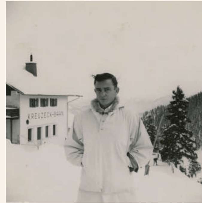
LINKSBOVEN Op verlof, Garmisch-Partenkirchen, Beieren, 1954