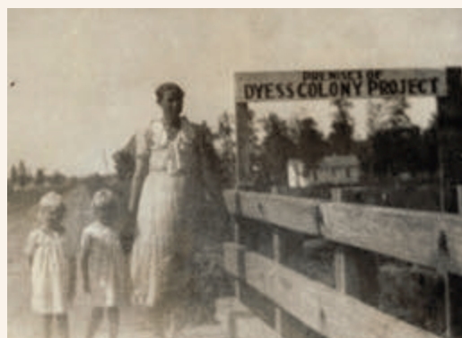
ONDER Eerste jaar op Dyess High School, 1947