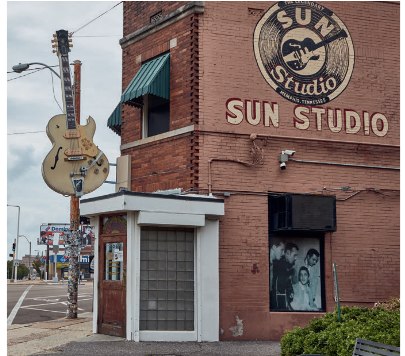
BOVEN Sun Studio, Memphis, heden