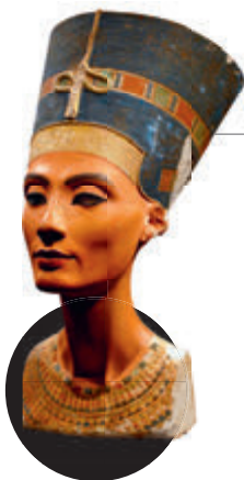
De buste van Nefertiti is gemaakt van gepleisterd kalksteen