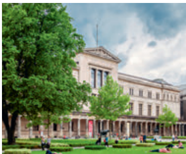
↑ Het museumgebouw, ontworpen door Friedrich August Stüler

Het Nieuwe Museum werd halverwege de 19de eeuw gebouwd om het overvolle Altes Museum te ontlasten. In 1945 raakte het gebouw zwaar beschadigd, maar renovatiewerkzaamheden hebben geresulteerd in een mooie combinatie van oude, gerestaureerde en nieuwe ruimten. De geschiedenis is voelbaar in elke zaal. De twee belangrijkste collecties zijn de Egyptische kunst met de papyrusverzameling en het museum voor prehistorie en vroege geschiedenis. De eerste toont 4000 jaar oude Egyptische en Nubische culturen, terwijl de laatste is gericht op Europa en delen van Azië. Speciale thema's en items zijn onder andere de 19de-eeuwse muurschilderingen met Noord-Europese mythologische taferelen, Trojaanse kunstvoorwerpen uit de collectie van Heinrich Schliemanns, de neanderthaler uit Le Moustier, de Berlijnse gouden hoed en de buste van Nefertiti.