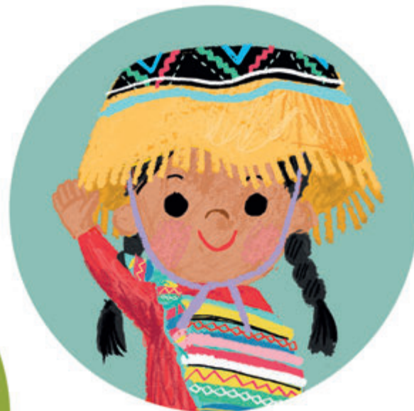
in het Quechua NAPAYKULLAYKI na-pai-koe-ja-kie (taal in de Peruviaanse Andes)