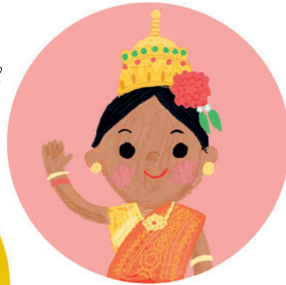
in het Thais SÀ WÀT DII sa-wa-die