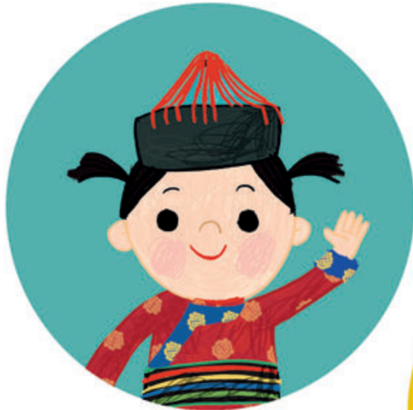
in het Mongools SAIN UU san-o

Zwaai eens op een andere manier naar iemand. Welke taal vind je leuk klinken?