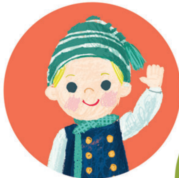
in het IJslands HALLÓ hal-lo