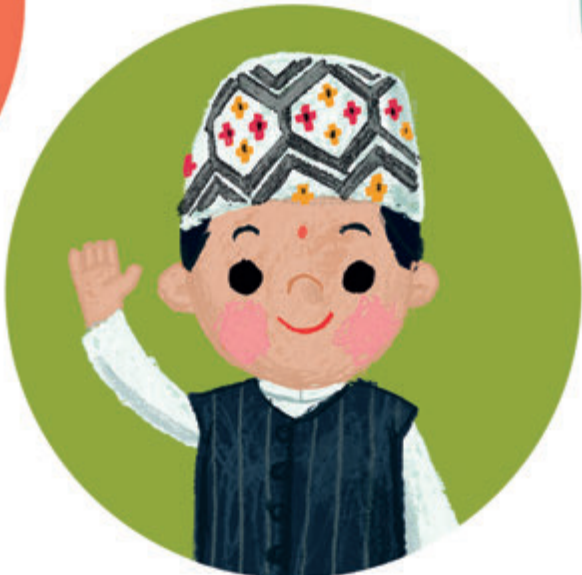
in het Nepalees NAMASTE na-mas-tee