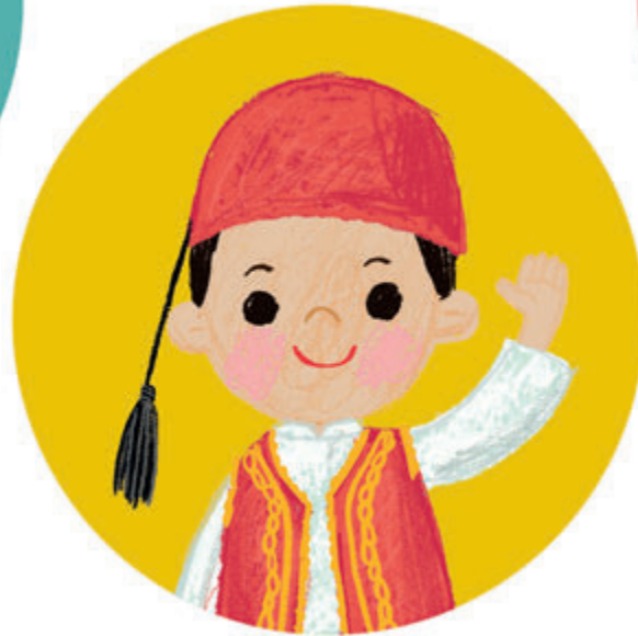
in het Grieks GIASOU ja-soe