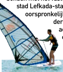
Windsurfen bij Vasiliki, Lefkada

Lefkada is de kleinste prefectuur van Griekenland en bestaat uit één hoofdeiland en enkele satellieten, waaronder Meganisi, Sparti, Madouri en Skorpidi. Hoofdeiland Lefkada is via twee bruggen verbonden met het vasteland. Op de noordoostelijke punt ligt hoofdstad Lefkada-stad, na een aardbeving in 1948 herbouwd in oorspronkelijke stijl. Het pittoreske eiland heeft een weelderige vegetatie en een adembenemend bergachtig landschap met olijf- en wijngaarden, en bossen met cipressen, dennen en platanen. De westkust is ruig, met inhammetjes en schilderachtige stranden, zoals het mooie Porto Katsikistrand, en aan de oostkust liggen de populaire plaatsen Nydri en Perigialia. In het zuiden ligt de Vasilikibaai, die populair is bij windsurfers.