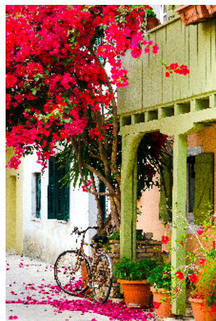
Straatbeeld in Lefkada-stad