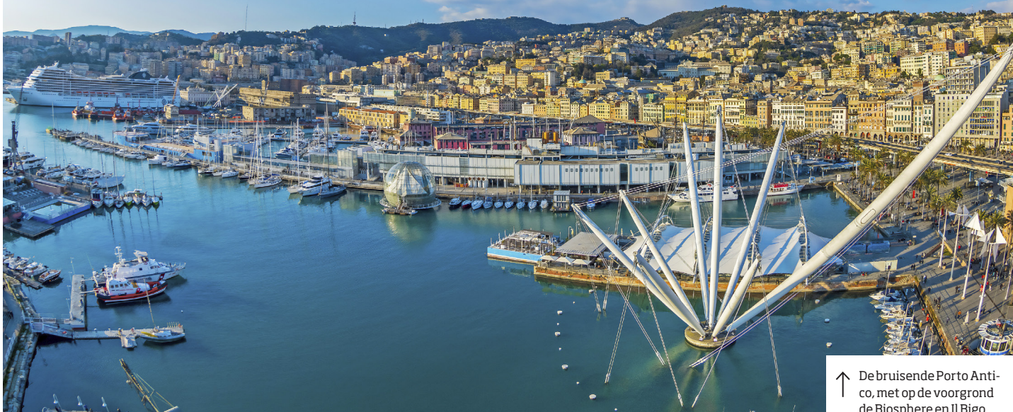
↑ Debruise Porto Antico, met op de voorgrond de Biosphere en Il Bigo