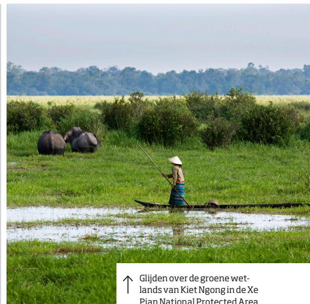
↑ Glijden over de groene wetlands van Kiet Ngong in de Xe Pian National Protected Area

Zuid-Laos is het wildbolwerk van het land. Het dunbevolkte Bolavenplateau, de ontoegankelijke bergen en de dichte bossen van de grensregio's bieden allemaal een toevluchtsoord voor wilde dieren. In de afgelopen decennia zijn er in het gebied diverse nieuwe zoogdiersoorten ontdekt, zoals de Laotiaanse rotsrat en de saola. Ook leven hier nog Aziatische zwarte beren, goudwang-gibbons en een klein aantal Indochinese tijgers.