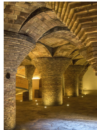
Gewelfd plafond van de vroegere stallen in de kelder van het Palau Güell

Het gebruik van paraboolbogen om de ruimte in te delen (blz. 91) is een