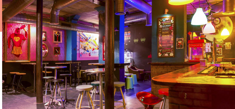
Oude filmposters en memorabilia in bar Polaroid in de stijl van de jaren 1980

📍 M3 📍 C/Banyes Nous 20 🌐 larcabarcelona.com Hier vindt u geweldige antieke kleding, van jurken uit de jaren 1920 tot baleinkorsetten, zijden shawls, blouses met pofmouwen en antieke bruidsjurken.