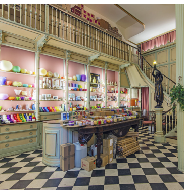
Handgemaakte kaarsen in de iconische winkel Cereria Subirà

📍 N1 📍 C/Fontanella 20 📍 Zo 🌐 sombrieriamil.com Deze honderdjarige hoedenwinkel biedt een mooi assortiment hoofddeksels (zoals de traditionele Catalaanse baret).