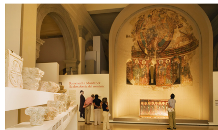
Links Madonna en Kind van Rubens Boven Voorwerpen in het Museu Nacional d'Art de Catalunya

de apsis domineren de Christus in Majesteit en de symbolen van de vier evangelisten en de Maagd, met de apostelen eronder.