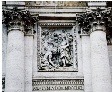
↑ Reliëf van Trivia die naar de bron wijst waaruit het water stroomt

Een beetje weggestopt op een eigenlijk vrij kleine piazza is hij daar ineens: de beroemdste en grootste fontein van Rome. De Trevifontein werd in 1762 door de Italiaanse architect Nicola Salvi gebouwd in een flamboyante rococostijl. Het is een travertijnen spektakel van steigerende waterpaarden, zeegoden, rotspartijen en palmbomen tegen de zijgevel van het Palazzo Poli.