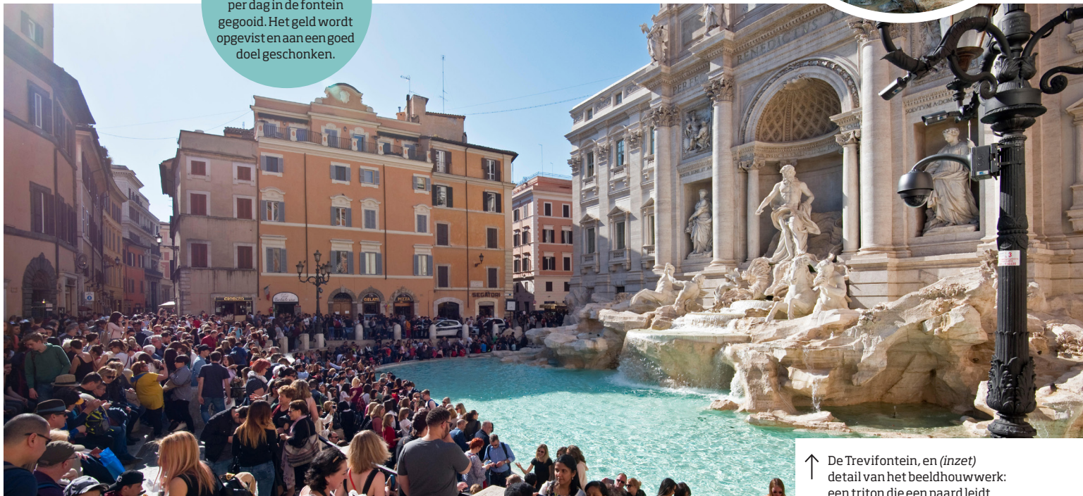
↑ De Trevifontein, en (inzet) detail van het beeldhouwwerk: een triton die een paard leidt

In 2001 werd bij de restauratie van een bioscoop een deel van de Acqua Vergine blootgelegd, het aquaduct uit de tijd van Augustus dat nog steeds de Trevifontein van water voorziet. De ondergrondse archeologische site 'De stad van het water' is nu deels te bezichtigen. U ziet er het aquaduct zelf, de ruïne van een oud Romeins appartementencomplex ( insula ), later omgebouwd tot een gezinswoning, en voorwerpen die in het gebied zijn gevonden.