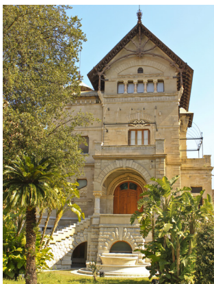
De statige Villino Florio