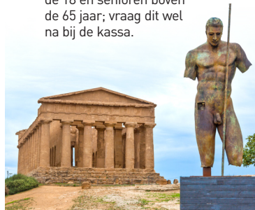
Valle dei Templi, Agrigento

Eerste zondag van de maand Het Griekse theater van Syracuse, de Valle dei Templi in Agrigento en het Palazzo Abatellis in Palermo zijn enkele bezienswaardigheden die op de eerste zondag van elke maand gratis te bezoeken zijn. Veel gemeente- en streekmusea zijn dagelijks gratis voor jongeren onder de 18 en senioren boven de 65 jaar; vraag dit wel na bij de kassa.