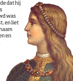
INÊS DE CASTRO

Om staatsredenen moest Pedro, zoon en erfgenaam van Afonso IV, trouwen met Costanza, Infanta van Castilië. Na haar dood ging hij in Coimbra wonen met Inês de Castro, een hofdame op wie hij verliefd was geworden. In de overtuiging dat de familie van Inês gevaarlijk was, liet Afonso IV haar in 1355 vermoorden. Na de dood van Afonso liet Pedro bij de twee moordenaars het hart uitrukken. Pedro beweerde dat hij met Inês getrouwd was geweest, en liet haar lichaam opgraven en kronen.