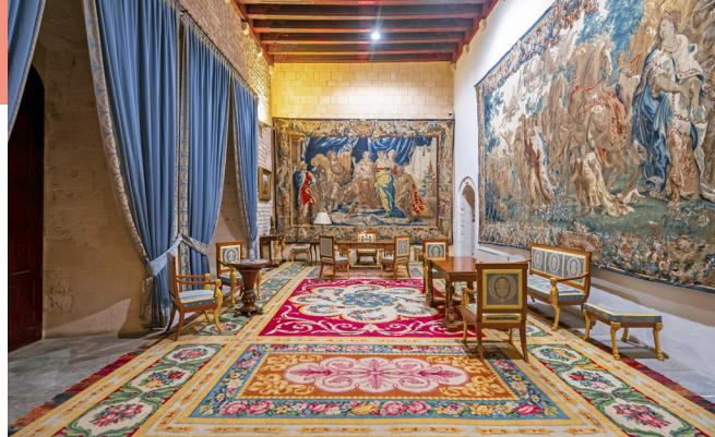
Vlaamse wandtapijten in het Palau de l'Almudaina

Sinds de stichting door de Romeinen heeft Palma, de hoofdstad van Mallorca, zich door de eeuwen heen ontwikkeld van een kustdorp tot een kosmopolitische stad. Het werd gevormd door Byzantijnse en Moorse bezetters die de middeleeuwse kern en de prachtige baden creëerden die nu nog steeds te zien zijn. In 1983 werd Palma de hoofdstad van de nieuw opgerichte Autonome Gemeenschap van de Balearen en tegenwoordig is het een bloeiende metropool met ongeveer 500.000 inwoners. De aantrekkelijke straten, historische gebouwen en vele restaurants, bars en winkels zorgen ervoor dat Palma een stad is die blijft boeien zoals het ooit Jaume I boeide. Na de verovering in 1229 beschreef hij de plaats als de 'mooiste stad die ik ooit heb gezien'.