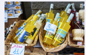
Het alcoholische limoncello

De beroemdste likeur is de citroenlikeur limoncello, die aardig sterk is.