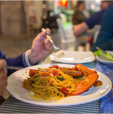
Een bord spaghetti geserveerd met kreeft