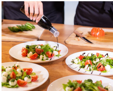
Een bord verse insalata caprese

Naast de verse sla en kerstomaatjes waarmee de Napolitaanse koks hun heerlijke salades ( insalata ) bereiden, komen er twee beroemde koude gerechten uit dit gebied. De insalata caprese is eenvoudig op zijn best en bestaat uit mozzarella di bufala , tomaten en basilicum. Caponata kan bestaan uit gemarineerde aubergine, artisjokharten en kappertjes, geserveerd met versgebakken brood om de smaak te absorberen.