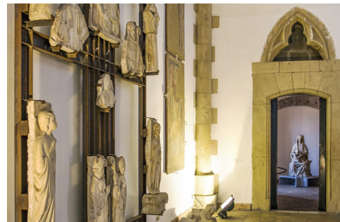
In de Cappella Palatina