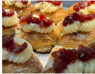
Heerlijk gebak te koop in een café in Napels