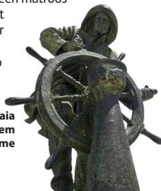
Beeld, Praia do Homem do Leme

📍 N3 📍 Ave de Montevideo 196 Een beeld van een matroos kijkt uit over dit zandbaaitje, ter ere van de visers van Foz do Douro.