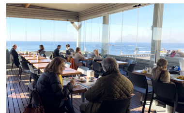
Lunchen op het dakterras van Tavi

Deze confeitaria (banketbakker) is beroemd om het gebak, koude pasteitjes, bolo de arroz (rijstcake) en andere taarten, en zeer geliefd bij de locals.