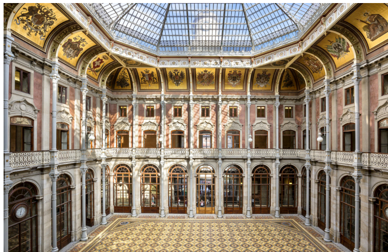
De glazen koepel van de Pátio das Nações