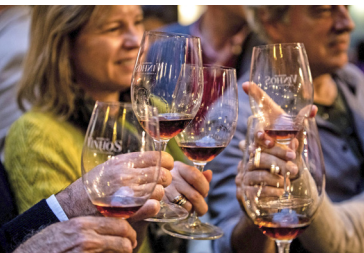
Het glas heffen tijdens de Essência do Vinho