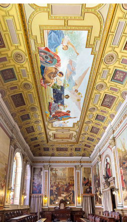
Rechtszaal in het Palácio da Bolsa

De stenen gevel van dit voormalige beursgebouw verraadt geenszins de weelde die binnen te vinden is. Het interieur is een overdaad aan rijkdom, kleur en extravagantie. Het pand werd gebouwd om rijke handelaren aan te moedigen om in de stad te investeren – en de rijkdom van het 19de-eeuwse Porto is overal in het gebouw te zien.