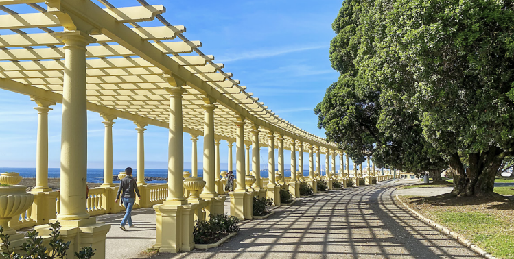
De neoclassicistische Pérgola da Foz met uitzicht op zee