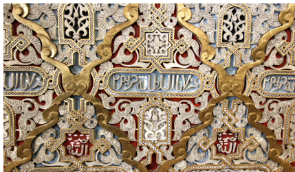
Muren met islamitische motieven in de Arabische zaal

Deze overweldigende granieten trap, in 1868 ontworpen door Gustavo Adolfo Gonçalves e Sousa, is verfraaid met talloze details. Het bovenlicht zorgt voor voldoende daglicht. Twee originele kroonluchters hangen boven de trap en herinneren aan het feit dat dit een van de eerste gebouwen in Porto was met elektriciteit.