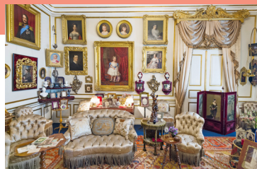
Portretten van de koninklijke familie in Amalienborg

Voor accommodatie in deze wijk, zie blz. 114