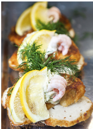
Drie traditionele vis-smørrebrød