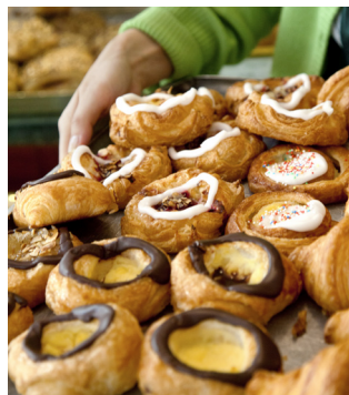
Selectie versgebakken Deens gebak

Denemarken staat bekend om zijn gebakjes en bij de vele bakkerijen in de stad kunt u volop proeven. Begin met kardemombroodjes, gevolgd door met marsepein bedekte rumcakejes, bekend als træstammer (boomstronken), en eindig met Spandauer – lichte ronde gebakjes met gehakte hazelnoten, room, fruit of jam en geglazuurd. Københavns Bageri (Flaskehalsen 22) heeft ze geperfectioneerd en ze smaken het best bij een warm drankje.