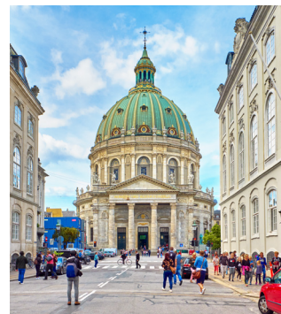
De imposante, barokke Marmorkirken