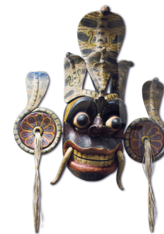
↑ Een schitterend masker in het Galle National Museum

Het Galle National Museum (blz. 106–107) toont archeologische en antropologische vondsten uit de zuidelijke regio van Sri Lanka. U ziet er traditionele maskers en houtsnijwerken.