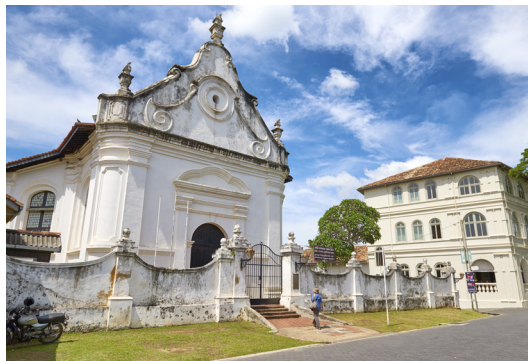
↑ De sobere witte gevel van de Dutch Reformed Church

Met de prachtige voorbeelden van koloniale architectuur en de goed bewaard gebleven vestingwerken is Galle Fort een sfeervolle plek. Midden in de oude stad, in de Nederlandse wijk, ligt het fort, een eind verwijderd van het drukke centrum buiten de muren. Al eeuwen voordat de Portugezen in 1589 een fort op de klip bouwden, trok de haven van Galle al handelaren, vissers en ontdekkingsreizigers, maar Galle Fort beleefde zijn hoogtij-dagen pas echt ten tijde van de Nederlandse overheersing. Nadat de Nederlanders in 1640 de haven hadden veroverd, bouwden ze verder aan de vestingwerken, die er nu nog staan, en werd dit het centrum van de Sri Lankaanse industrie.