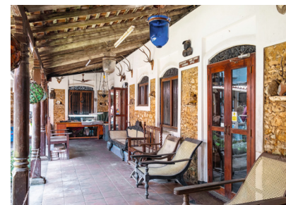
↑ De veranda van het Historical Mansion Museum, gemeubileerd met periodestukken