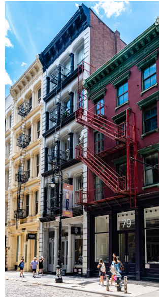
Gietijzeren details op de gebouwen aan Greene Street

Voor accommodatie in deze buurt, zie blz. 177