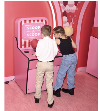
Interactieve expositie in het Museum of Ice Cream

Dit populaire museum biedt prachtige multisensorische installaties rond het thema ijs. Hoogtepunten zijn onder meer de betoverende 'Rainbow Tunnel', de grootste indoor glijbaan van Manhattan, en de 'Sprinkle Pool', een kleurrijk zwembad gevuld met 100 miljoen antimicrobiële, biologisch afbreekbare (en oneetbare) sprinkles, die vanwege de hygiëne regelmatig worden schoongemaakt.