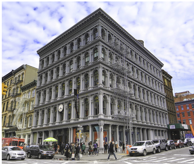
Indrukwekkende gietijzeren gevel van het Haughwout Building

Dit meesterlijke gietijzeren bouwwerk uit 1857 huisvestte een porselein- en glashandel. De bogen met zuilenrijen zijn geïnspireerd op de gevel van de Sansovinobibliotheek in Venetië. Dit motief wordt 92 keer herhaald over de hele voorzijde van het pand. Bij een renovatie in 1995 werd het vuil verwij-