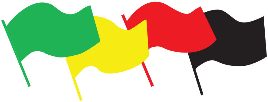
Figuur 1.1 Sensoa Vlaggensysteem