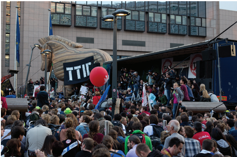
Mondialisering heeft de afgelopen decennia om verschillende redenen weerstanden opgeroepen. Op de foto een demonstratie in Brussel (2016) tegen TTIP, het inmiddels bevroren vrijhandelsverdrag tussen de EU en de Verenigde Staten.