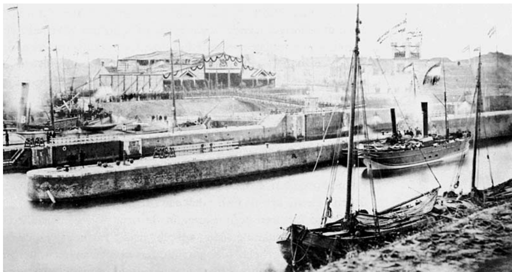
Opening Noordzeekanaal 1876

Wat zouden de consequenties zijn indien de Europese landbouwsubsidies zouden worden afgeschaft?