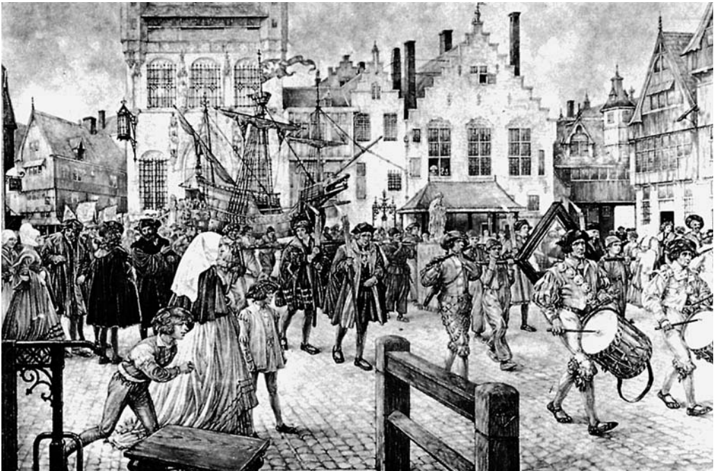
Gildeoptocht in Antwerpen