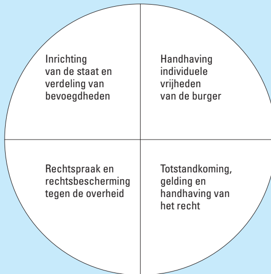
Figuur 1.2 Hoofdpijnen van het staatsrecht